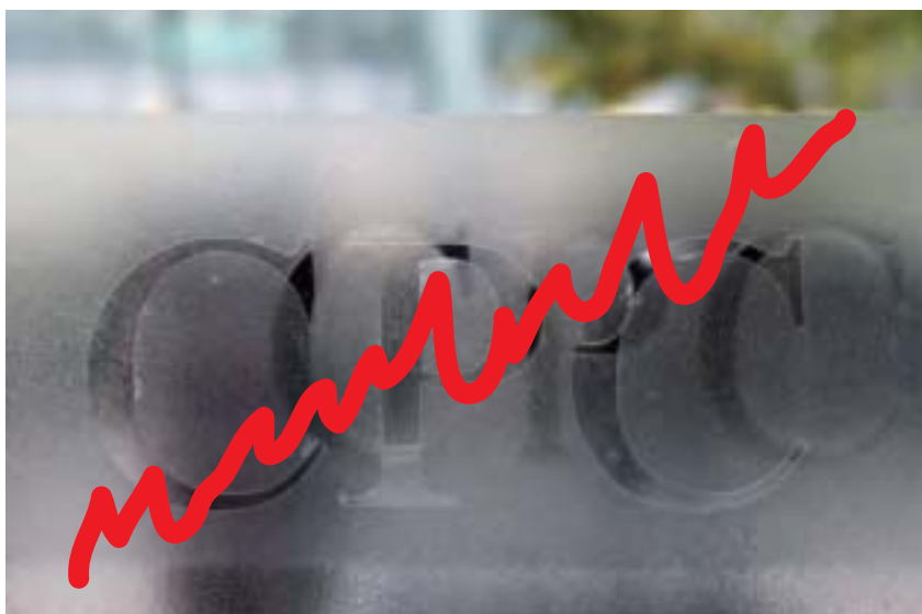
習近平曾多次提到「亡黨危機」，曾任職中共總參謀部的中共大將羅瑞卿之子羅宇表示，習近平有可能不再搞什麼黨主席，而是選總統，誰選上誰來當。（新紀元合成圖）

頂住來自各方的角力干擾，強勢主導人事布局，那今秋的六中全會，乃至明年的 19 大，習當局會有外人難以想像的變革，譬如：取消政治局常委制，破除「七上八下」年齡劃線規則，廢除隔代指定接班人的做法，都會循序推進。