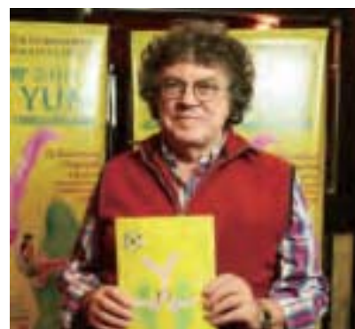
阿根廷著名歌唱家、歌詞作家Piero de Benedictis