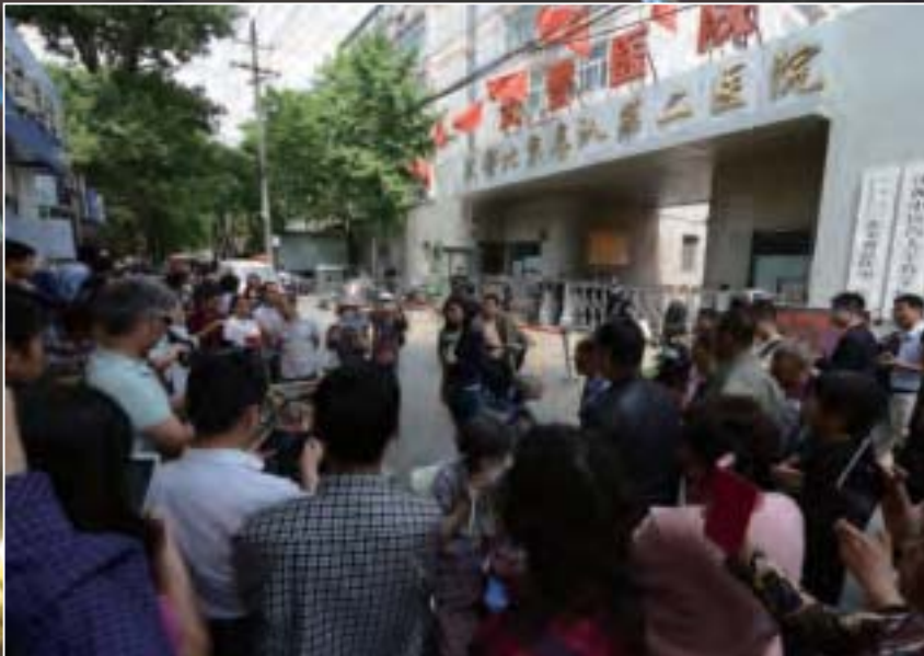
5月4日上午，深陷魏則西死亡事件漩渦的武警北京總隊第二醫院貼出停診通知。