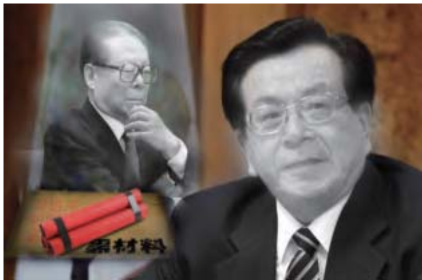
習說的野心家也包括江澤民，其「退而不休」搞特權和干政。而江的「狗頭軍師」曾慶紅老謀深算，曾試圖取代胡成為國家主席。（新紀元合成圖）

據《動向》2014年10月號報導，2014年9月28日中共內部座談會上，胡錦濤列舉了2003年至2012年間江澤民向中共中央政治局提出4000多條「建議」和「意見」，提名中共中央、地方省部級官員超過