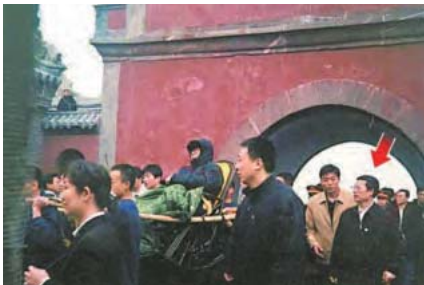
中共江派現常委張高麗2006年巴結江澤民「抬轎上位」的舊照網路熱傳。

而張高麗是江澤民提拔起來的江派常委，張任山東省委書記時，為了巴結江澤民，不但下令封泰山，還讓8人「抬著轎子」讓江坐在裡面，自己緊隨其後，前呼後擁地爬泰山。✘