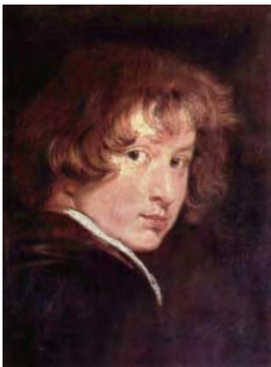
←安東尼·凡·戴克〈自畫像〉，約作於1613至1615年，木板油畫，維也納藝術專科學院博物館藏。

「作為一個少年人，他對魯本斯的模仿惟妙惟肖，我們幾乎很難分清他們兩人的作品。」弗里克收藏館歐洲繪畫部北方巴洛克繪畫助理策展人亞當·埃克