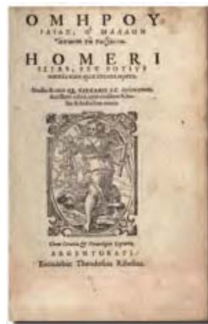
1572年Rihel公司出版的《伊利亞特》的封面。（公有領域）

5693行。講述希臘聯軍與特洛伊十年戰爭的最後一年的戰事。故事涉及人物眾多，包括戰爭雙方的人類以及捲入人類戰爭的奧林匹斯山眾神。