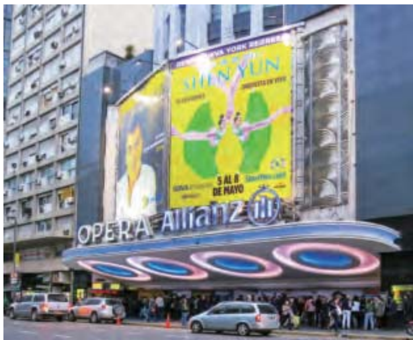
美國神韻巡迴藝術團在阿根廷首都布宜諾斯艾利斯進行了今年在當地的4天5場演出，締造場場爆滿的票房佳績。

靈魂和精神的慰藉。」Andy Freire認為，做為公務員，他從中華傳統價值觀中得到啓迪：「我可以