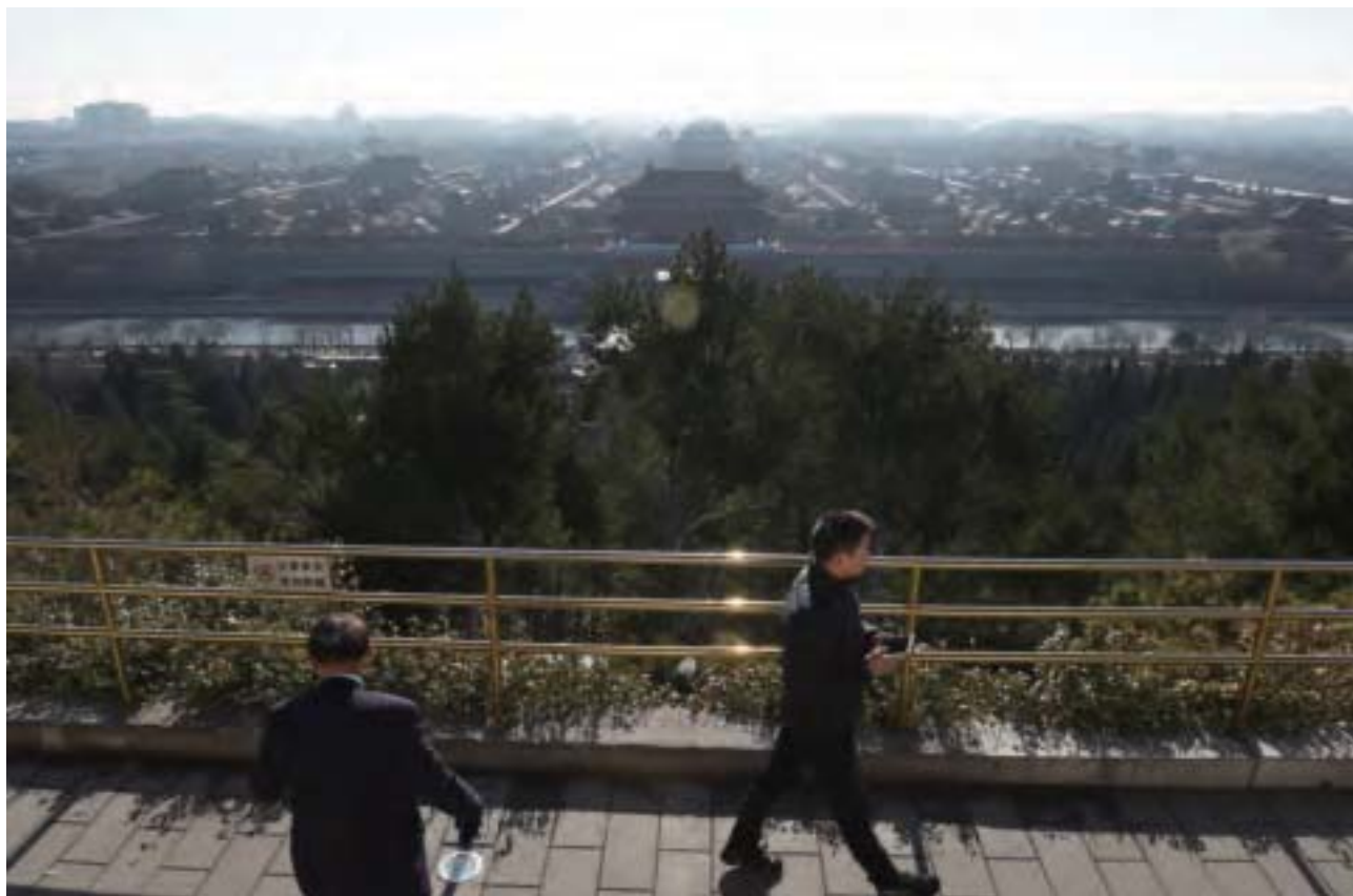
習近平罕見的使用了中共文宣系統長達35年沒有使用過的「野心家」、「陰謀家」等政治定性用詞，瞬間把經濟上的反腐，提升到了政治路線的博弈中。

最引人注目的當然是最後一個了。習近平罕見的使用了中共文宣系統長達35年沒有使用過的「野心家」、「陰謀家」等政治定性用詞，瞬間把官方公開揭示的經濟上的反腐，提升到了政治路線、政治方針上的博弈中，從而印證了2012