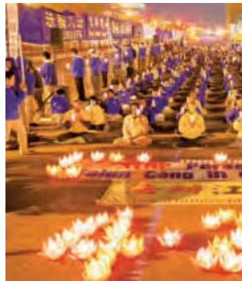
王友群將致習近平的信，寄給中共駐紐約總領事章啓月轉信。圖為4月24日晚，紐約部分法輪功學員近千人在中領館前紀念「4·25」和平上訪17周年。