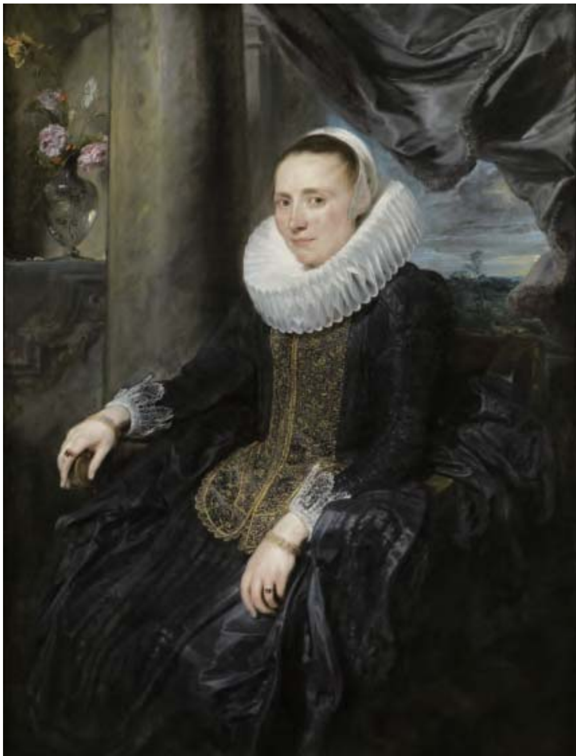
凡·戴克為斯奈德斯之妻瑪格麗特·德沃斯 (Margareta de Vos) 所作的肖像。(公有領域)