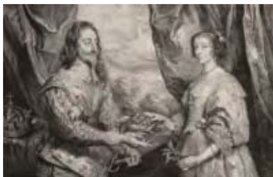
〈拿桂冠的查理一世和瑪麗亞·亨麗埃塔〉局部，這幅蝕刻版畫是羅伯特·凡·弗洛厄斯特 (Robert van Voerst, 1597至1635/36) 1632年據安東尼·凡·戴克的油畫雕版製作的，溫莎堡伊麗莎白二世皇家收藏。