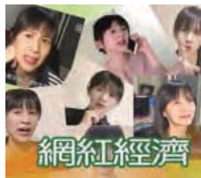
當中國2015年GDP出現25年來第一次低於7%，實體經濟衰退，造成資金湧向網紅經濟。有專家示警，中國網紅經濟恐是大蕭條前的最後狂歡！（新紀元合成圖）

網路直播有秀場直播、遊戲直播、泛娛樂直播、廣告及遊戲聯運等各種商業模式；根據中國「每日經濟新聞」報導，到2015年底，中國各類直播平臺近200家，用戶數