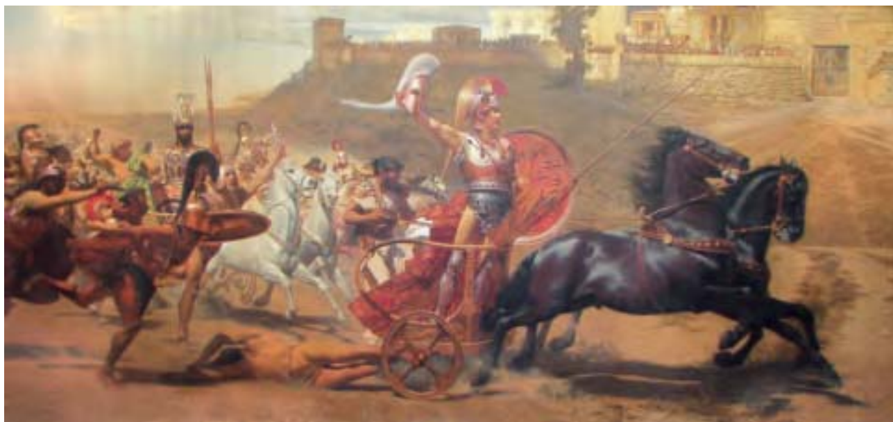
〈阿基里斯的凱旋〉，Franz Matsch繪，阿基里斯宮藏。（公有領域）

顧；阿伽門農更是愚蠢傲慢，為一點點利益便不惜破壞盟友間的信任……對比這些，赫克托爾則表現出真正的英雄氣概，不僅戰鬥勇武，同時品性端正，從不為私廢公、損人利己。