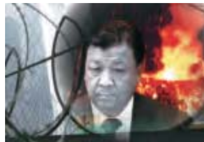
海外媒體消息指，習近平當局對中宣部的改革就要開始，掌管宣傳系統的江派常委劉雲山成了人們期待落馬的大老虎之一。

文章說，「中共的文宣系統動不動就將矛盾上綱上線為敵我矛盾，甚至還冒出『階級鬥爭是不可能熄滅的』言論，與歷史潮流不符。這種霸道的鬥爭思維，跟不上經濟基礎發展腳步，在經濟領域發生了巨大變化的今天，理論和意識形態領域卻嚴重滯後，甚至被詬病為『八股』」。