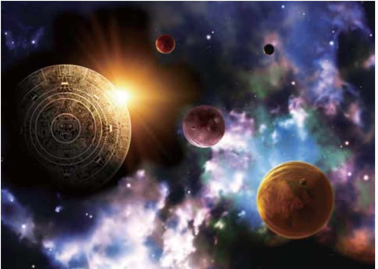
瑪雅曾有預言，2012年12月12日，整個地球發生徹底的變化。