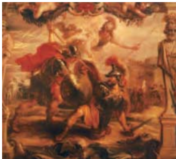
〈阿基里斯殺死赫克托爾〉，1630年至1635年，彼得·保羅·魯本斯畫作。（公有領域）