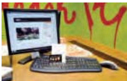
有教授將上課投影片放在課程網站上，還有講課錄音，這樣學生可以依照自己的進度下載複習。圖為在紐約有付5元美金可上網學習課程的教室。

本科生通常必選跨領域的通識課程，這意味著更多的教師在班上看到外國學生。當紐教授15年前開始教書時，國際學生非常少，現在是10%左右。