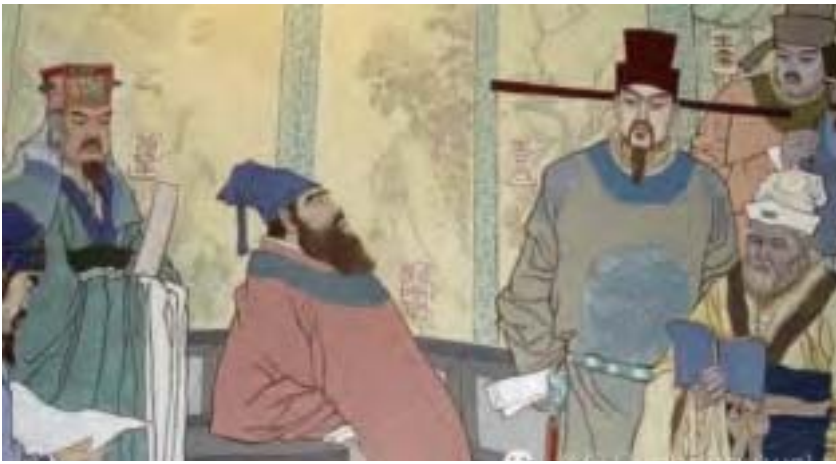
「夫信者，人君之大寶也。」

歷代論天下者喜談純王之政，不過，三王而降不復有王，五霸之世兵爭天下。換言之，五霸以後，所謂的純王之政幾如華胥之國，只是一種理想。而後世人君所行皆是王霸之道。那麼霸道又是什麼呢？也許從孔子對管仲的評價中可以窺見一斑。春秋五霸，以齊桓為首，齊桓稱霸，皆管仲之力。就是說管仲是一個真正懂得霸道的人。而孔子這位儒家的至聖先師對管仲佐齊桓稱霸的評價卻是「如其仁，如其