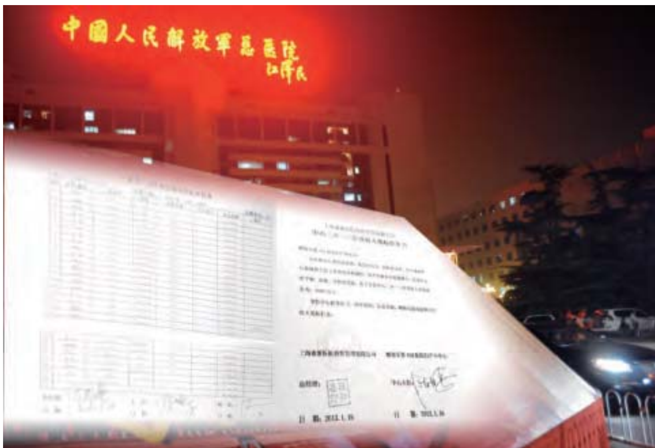
江澤民放縱軍隊大肆經商，軍隊出現前所未有的腐敗。網民爆料，軍隊醫院個人受賄表（左），及莆田系康新醫院與南京解放軍454醫院婦產科合作斂財（右）。（新紀元合成圖）