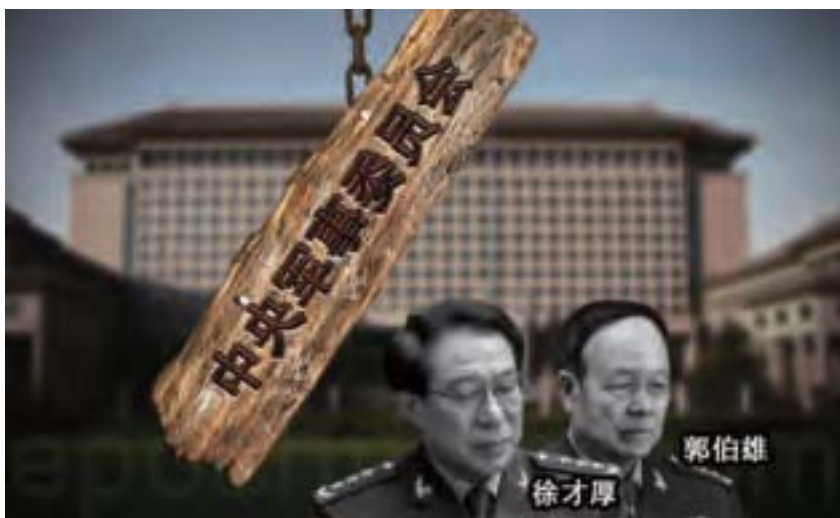
郭伯雄、徐才厚是江澤民提拔起來的心腹，替江把持軍權10多年，他們曾私議：「讓他（指習近平）幹5年就走人！」（大紀元合成圖）

而郭伯雄、徐才厚是江澤民提拔起來的心腹，替江把持軍權10多年，架空了時任軍委主席胡錦濤的權力。據港媒報導，郭、徐還曾阻擊習近平進軍委，習近平進入軍委後，他們還私議：「讓他（指習近平）幹5年就走人！」