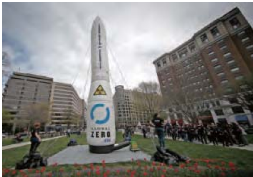
4月1日華盛頓特區第四屆核安全峰會場外的反對核彈集會。

核戰爭的危險是從製造出核武器就開始了。如果發生核戰爭，第一場核戰役就會導致幾千萬甚至幾億人喪生，之後會有更多的人死於核冬天。雖然冷戰過後核危