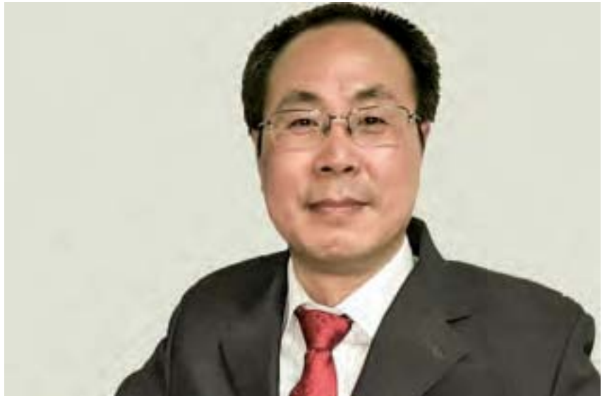
原中共中紀委監察員王友群於6月26日向大陸最高檢察院檢察長曹建明寄出控告信，強烈要求逮捕江澤民。