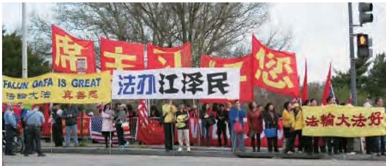
華盛頓DC部分法輪功學員呼籲習近平將迫害法輪功的元凶江澤民繩之以法。

一波起，魏則西魂靈未安息，雷洋又遭不測。所有一切細想想，平著看，武警醫院、莆田系、百度、央視、北京公安猖獗；往上走眼就露餡兒：江蛤蟆匪幫的陳至立禍亂的教育衛生口、前維穩沙皇周永康無法無天的公安政法口、東北虎徐才厚西北狼郭伯雄全面操控的軍隊武警醫院口、蛤蟆骨朵江綿康運作的GFW和電信口……這些摧毀中國良心道德民風文明的關鍵體系，一個不落的抓在江澤民及其狂妄馬仔手中，除了瘋狂斂財不惜摧毀中國子孫資源，最後爲了打壓真善忍群體，連活摘活人器官這樣畜生不如的勾當都幹得出來！