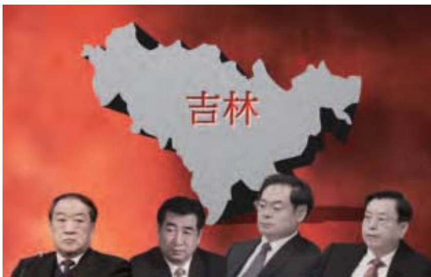
蘇榮（左一）是江派二號人物曾慶紅的心腹，他與「吉林幫」幫主張德江（右一）幾乎結成異姓兄弟，曾緊跟江澤民集團殘酷迫害法輪功而發跡。

蔣潔敏：中共國資委前主任蔣潔敏，任青海副省長後，曾對看望他的老同事放「豪言」：「生進中南海，死入八寶山。」蔣潔敏2013年9月落馬，2015年10月被判處16年徒刑。不過也有人指出，這句話最早來源於1980年代到遼寧基層的薄熙來。蔣潔敏只是學薄熙來而已。