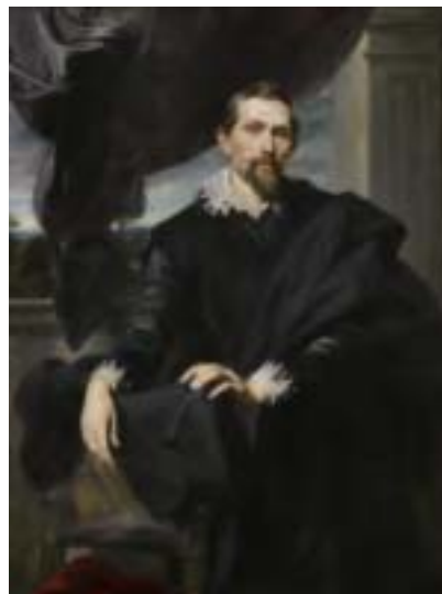
安東尼·凡·戴克〈弗蘭斯·斯奈德斯像〉，約作於1620年，布面油畫，紐約弗里克收藏館藏。