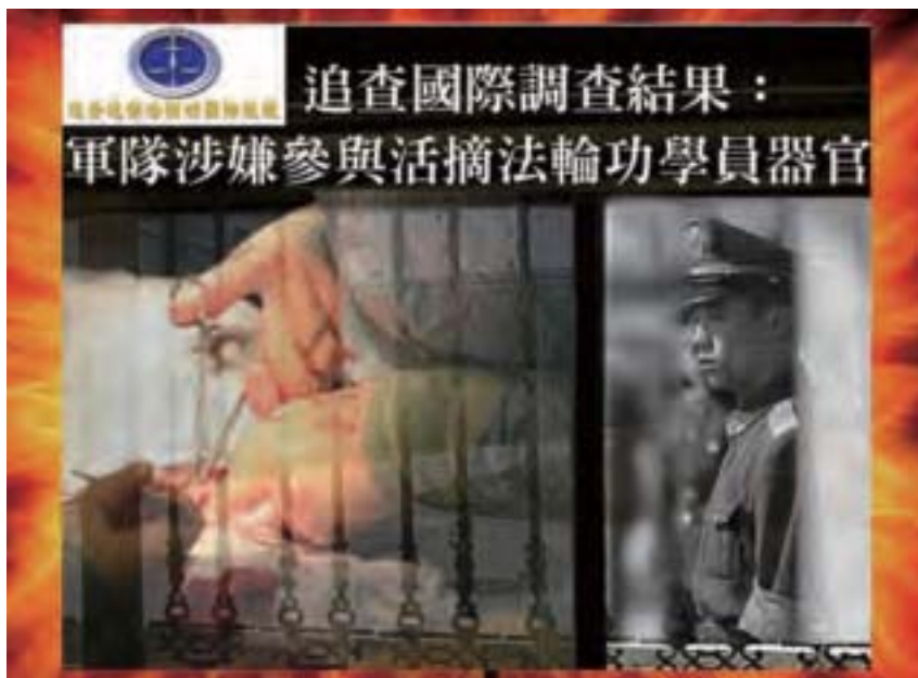
中共軍隊武警系統大量參與活摘器官，軍隊、武警醫院和器官移植中心為活體摘取法輪功學員器官的主要場所。

調查中也顯示，中共軍隊武警系統大量參與活摘器官，軍隊、武警醫院和器官移植中心為活體摘取法輪功學員器官的主要場所。在調查錄音中，中共軍方205醫院表示，活摘法輪功學員器官是「經過