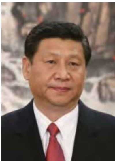
有媒體披露，3月北京西山「社會主義社會民主制度和機制改革、發展的反思研討會」，習近平曾三次到場講話，強調「不能再等待了，我們這一代人不能辜負人民的期待、呼籲。」(AFP)

報導並指，王滬寧在會上提出，中委和政治局在現行憲制上的地位和運行，存在「較大缺陷和阻