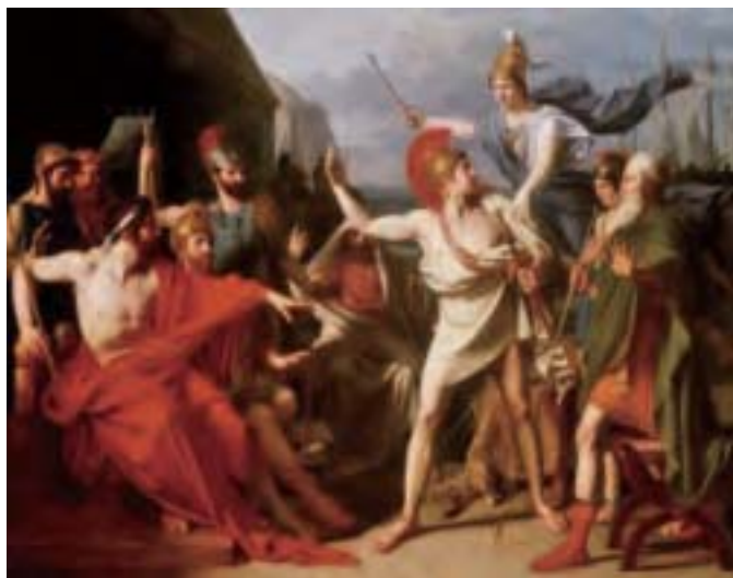
〈阿基里斯的憤怒〉，1819年，邁克·德羅林（Michel Drollig）畫作。（公有領域）