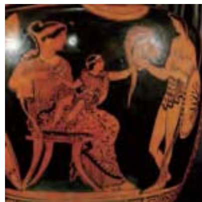
赫特托爾在決鬥前最後一次與妻子安卓瑪姬與兒子阿斯泰安奈克斯相聚的情景，見於公元前四世紀的陶器。

在描寫赫特托爾出戰前與妻兒告別的場面時，既表現了他英雄柔情忠貞的一面，也表現出自古在英雄面前忠孝家國無法兩全的矛