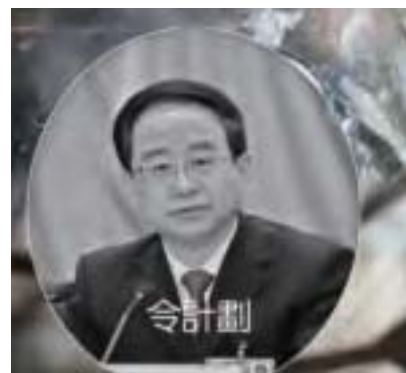
中辦前主任令計劃野心也不小。2012年3月令計劃兒子車禍身亡後，為掩蓋其子死因，遂與周永康達成某種政治約定，但隨即敗露，令的仕途由此逆轉。（大紀元合成圖）

的具體內容，但有報導稱，令計劃之子令谷死於法拉利車禍後，為了掩蓋真相，時任政法委書記周永康與令計劃見面，就令谷車禍的處理等問題雙方達成一項「大生意」：周願意支持令計劃以習近平之後的繼任者身分進入常委會，先擔任中