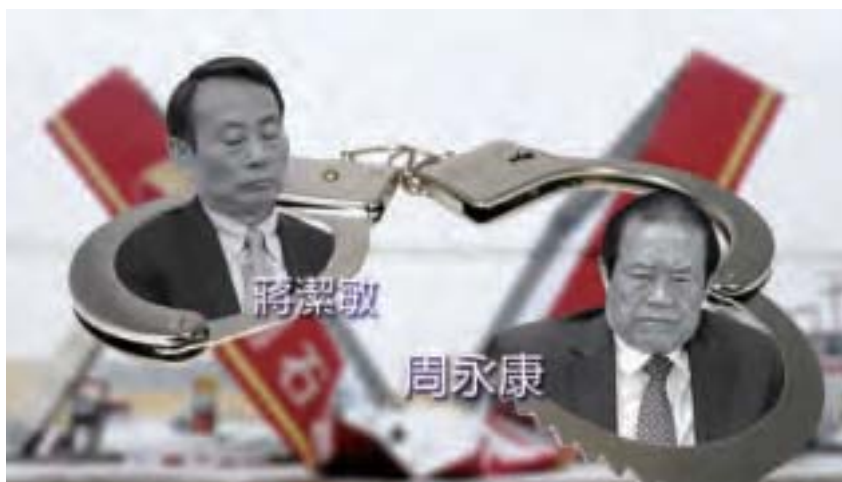
中共國資委前主任蔣潔敏是周永康「石油幫」的重要成員，曾揚言「生進中南海，死入八寶山。」將於去年10月被判處16年徒刑。（大紀元合成圖）