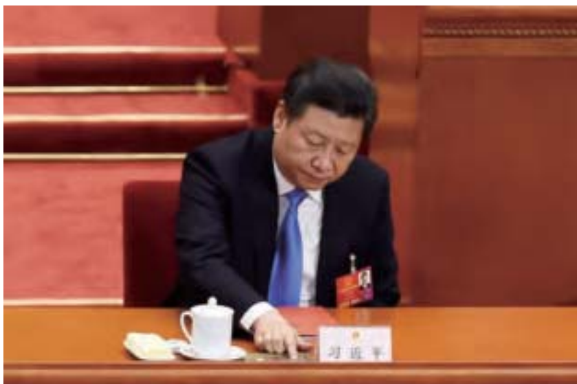
習近平的內部講話公布全文，是對劉雲山掌控的宣傳系統不斷對習當局反腐和改革進行挖坑的一種回擊。

報導轉述當地會議傳達了「6·26」反腐講話的部分內容，習罕見地用放下生死的態度表示，「與腐敗作鬥爭，個人生死，個人毀譽，無所謂。」這是非常非常不平常的一番表態。會上習還對