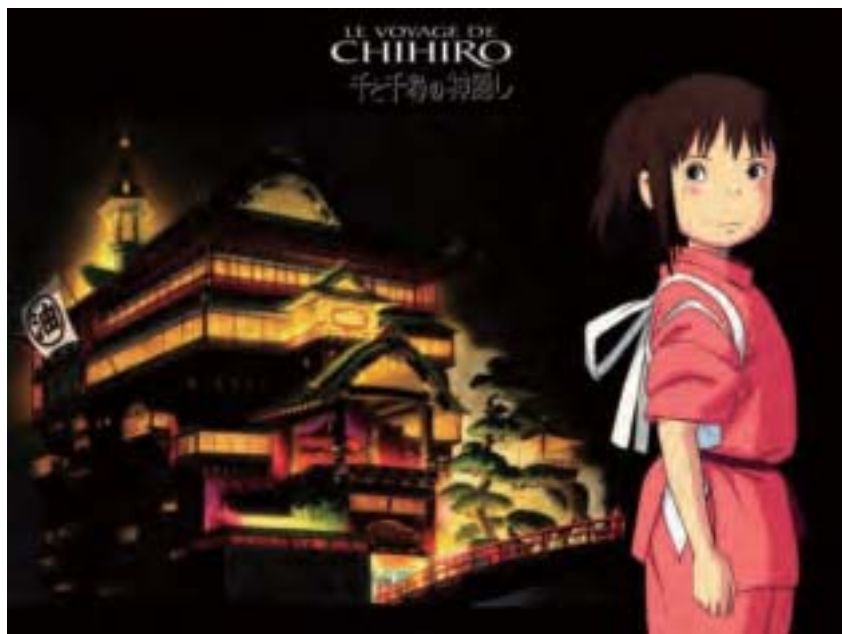
《千與千尋》2001年首映，為日本史上票房最高的電影，並在全世界多次獲獎。

千尋因保持清醒，發現了那個世界的不一樣，對其保持警惕，從而保住自己的本體沒有被改變；但千尋的父母卻禁不住美食的誘惑，在貪婪和慾望的控制下不停的吃，最終不知不覺的變成了豬。不勞而獲、貪吃貪睡等這些不良習性都是