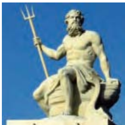
坐落在丹麥哥本哈根的海神波塞冬雕塑。