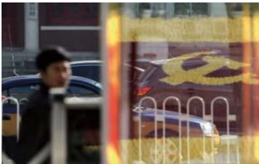
陳至立是江澤民情婦中級別最高女官員。據說，江與陳至立幾十年關係「牢不可破」，是醜惡的政治組合。