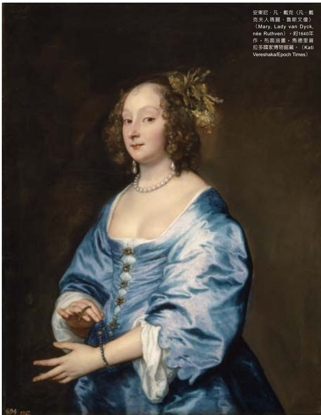
安東尼·凡·戴克〈凡·戴克夫人瑪麗·魯斯文像〉 (Mary, Lady van Dyck, née Ruthven), 約1640年作, 布面油畫, 馬德里普拉多國家博物館藏。