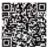
亞太區初賽報名表