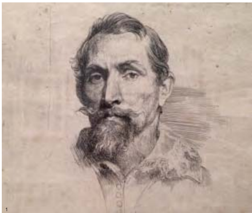
1. 安東尼·凡·戴克〈弗蘭斯·斯奈德斯像〉，約作於1627至1635年，蝕刻版畫，美國哈佛大學佛格美術館藏。2. 安東尼·凡·戴克〈小彼得·勃魯蓋爾像〉，約作於1627至1635年，蝕刻版畫，美國哈佛大學佛格美術館藏。3. 安東尼·凡·戴克〈亨德里克·凡·巴倫像〉，約作於1627至1635年，蝕刻版畫，美國洛杉磯保羅·蓋蒂博物館藏。(Kati Vereshaka/Epoch Times)