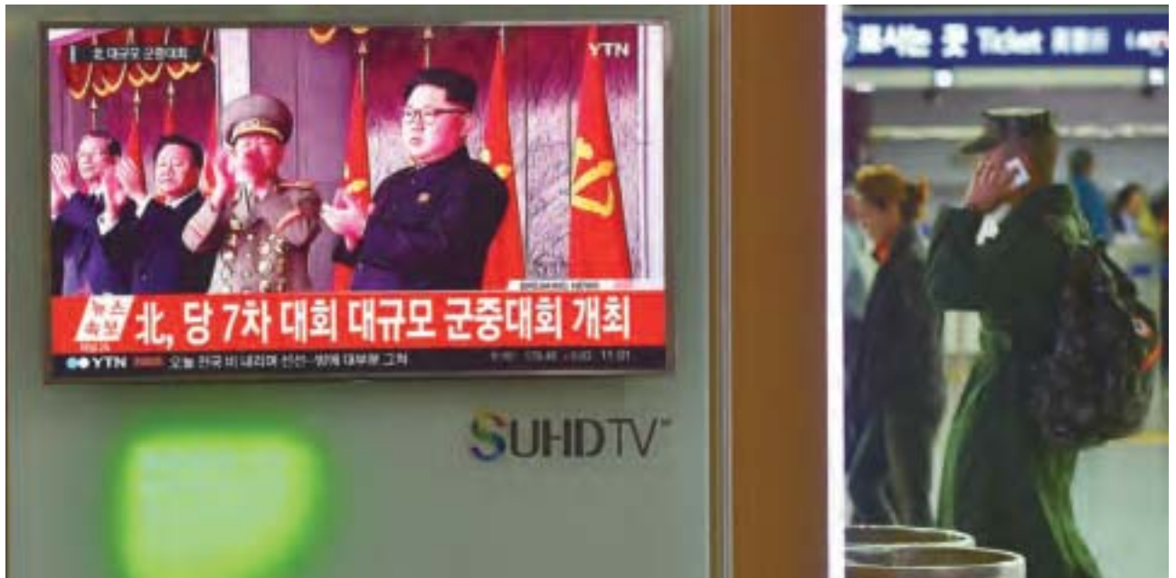
北韓勞動黨5月6日在平壤舉行了第7次黨代表大會，被認為是確認金正恩領導地位的加冕儀式。

北韓勞動黨5月6日在平壤舉行了第七次黨代表大會，這是自1980年的勞動黨「六大」以來的再次召開。據BBC報導，此次會議安排嚴密，數千名官員在會上向金正恩表達支持，被認為是相當於金正恩的加冕儀式，確立其未來領導地位的