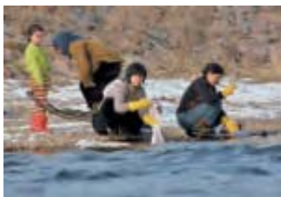
北韓今年進行第四次核試後，被聯合國嚴厲制裁，已對北韓經濟和民衆的生活產生影響。圖為北韓婦人在新義州鴨綠江邊洗衣服。

此後，北韓當局又數次發射火箭與導彈。4月9日，北韓宣布進行了新型洲際彈道火箭發動機的地上點火試驗。4月28日，北韓一天兩