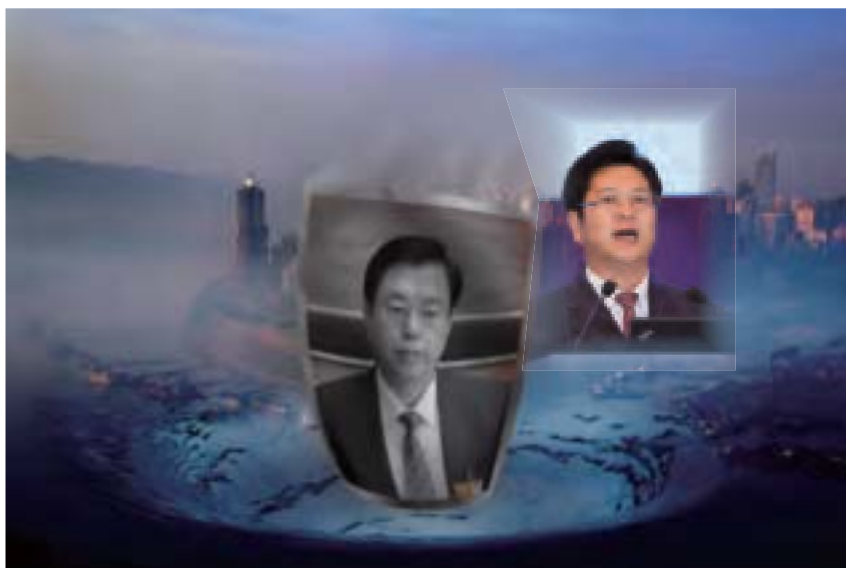
多年來東莞的色情業在劉志庚的包庇下不斷攀高峰。劉志庚「帶病」不倒還一路升，是因為有張德江的「鼓勵與肯定」。

4月25日最高檢發布消息，已經對廣東省原副省長劉志庚以「涉嫌受賄罪」立案偵查。劉志庚今年2月4日被查，20天後被免職；4月18日被開除黨籍，一周內即正式立