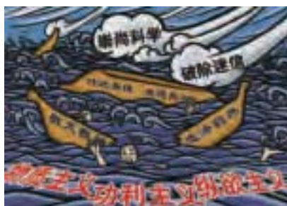
共產黨的無神論是毀滅民族文化的毒藥。(大紀元)