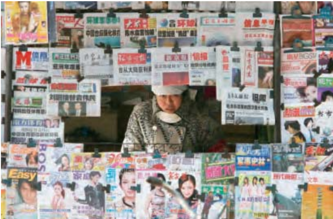
中共中宣部掌管中國兩千多家報紙、近萬種期刊、上千家廣播電臺和電視臺，及上百萬個網站的輿論導向。中宣部名聲太臭，也嚴重衝擊習施政凝聚民心。圖為北京報攤。

部、新聞出版廣電總局等首當其衝。中央巡視組由王岐山舊部、中央巡視工作辦公室主任黎曉宏親自督陣。