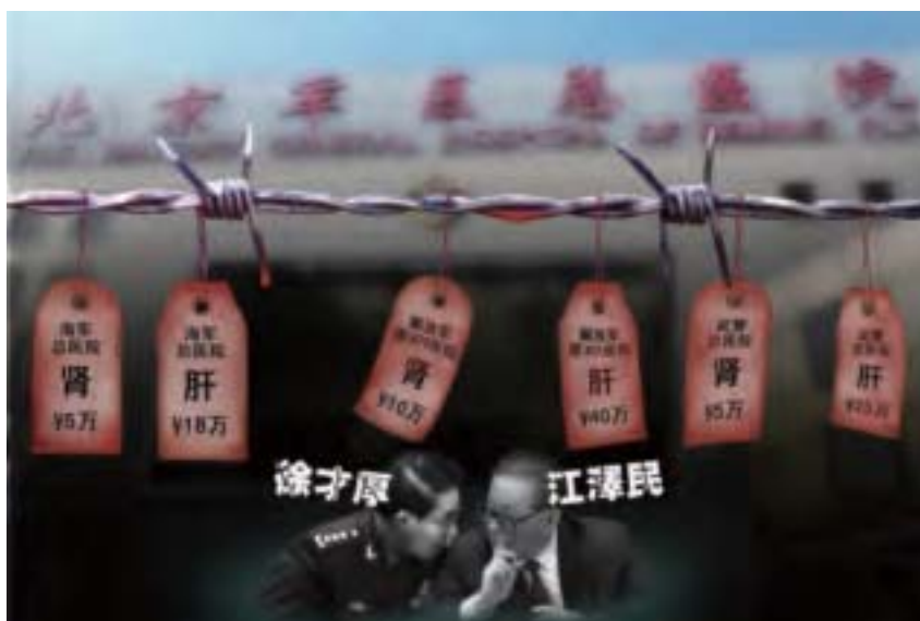
江澤民在軍中大搞貪腐治軍，以收買人心。1998年江雖被迫提出「軍隊不許經商」，但留下一個「有償服務」的尾巴。而活摘器官、器官移植，都是有償服務的。

朱鎔基看到軍隊經商嚴重打亂正常的經濟秩序，在1996年就提出軍隊應當禁止經商的問題。1998