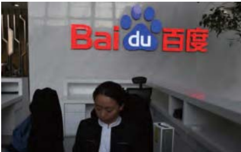
「魏則西事件」揭開百度與莆田系相互勾結的黑幕，5月2日，中央三大部委組成聯合調查組進駐百度。(AFP)