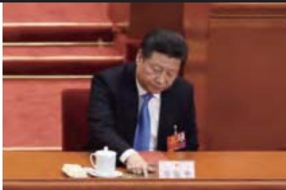
習近平的內部講話公布全文，是對劉雲山掌控的宣傳系統不斷對習當局反腐和改革進行挖坑的一種回擊。