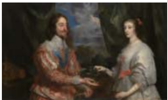
安東尼·凡·戴克〈拿桂冠的查理一世和瑪麗亞·亨麗埃塔〉局部，1632年作，布面油畫，紐約弗里克收藏館藏。