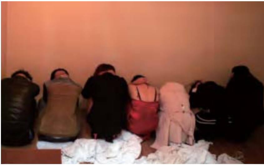
劉志庚讓東莞黃色腐敗攀高峰近日成為媒體關注的焦點。

面是老闆，老闆後面是老虎」。現在劉志庚落馬，外界始知他不僅是業者的大後臺，其多位家屬近親就是業者。