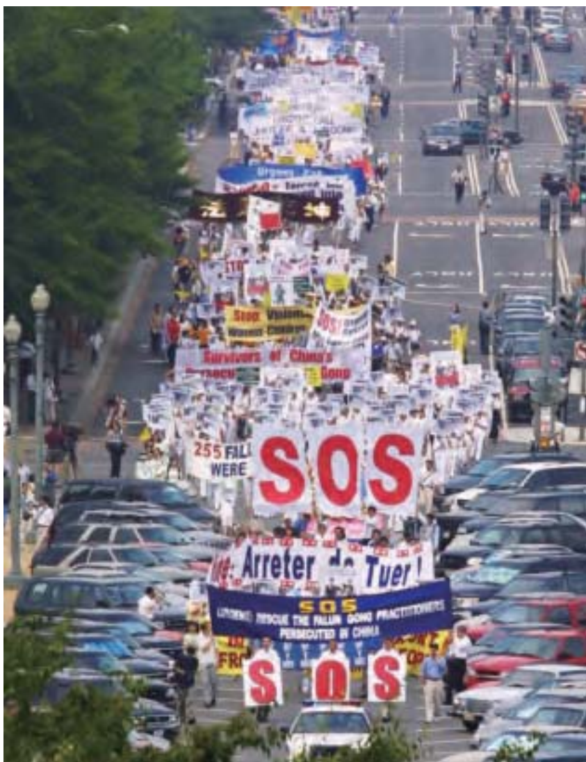
中共會頓滅還是漸滅呢？這其實不單單是哲學或政治學上的思辨，而更是道德和理智上的判斷。圖為在美國首都華盛頓舉行的解體中共、停止迫害大遊行。

中共有沒有10-15年的壽命呢？有人一廂情願，有人糊里糊塗。在筆者看來，它不會有了。如果說，中共統治的基礎目前只剩經濟，已經沒有了人心和天意的基礎，那中國經濟繼續放緩、停滯、滯脹，基礎沒了，中共統治安得不隨之瓦解呢？中國經濟會不會突然坍塌呢？中共自己都說過，文化大革命後期，中國的國民經濟已經到了「崩潰的邊緣」，這可是中共自己說的，他們也知道經濟有崩潰的可能。文革後的中國經濟其實已經崩潰了，只不過，中共用上山下鄉，把青少年流放到鄉下，減低了城鎮失業率，躲過了一劫。如今，城鎮青少年不會下鄉，農村農民工