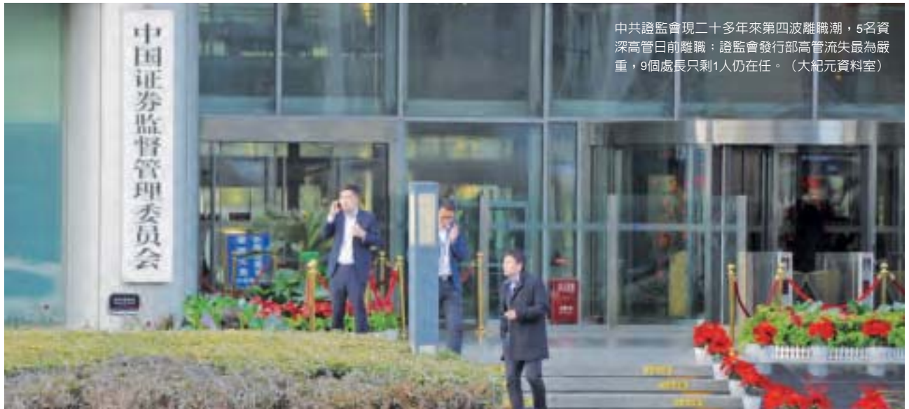
中共證監會現二十多年來第四波離職潮，5名資深高管日前離職；證監會發行部高管流失最為嚴重，9個處長只剩1人仍在任。