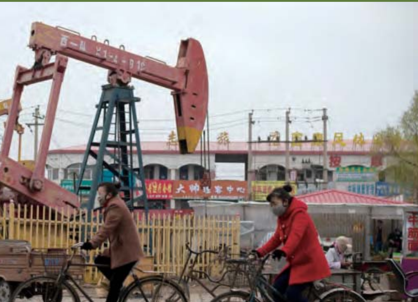
據報告顯示，今年前四個月黑龍江省民間投資「增長13.1%」。黑龍江省GDP增速全國倒數第三，投資反而很好，事有蹊蹺。圖為黑龍江大慶。

表示「保護生態，留一張白紙」，以及李克強國務院4月底《關於全面振興東北地區等老工業基地的若干意見》中推動黑瞎子島的保護，均有明顯衝突。