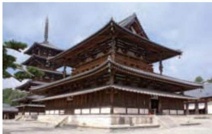
日本聖德太子執政期間的飛鳥時代在奈良縣興建的法隆寺。

此次日本遣隋使遞交的國書中寫道：「日出處天子致書日沒處天子，無恙。」顯然，曾經仰視、尊崇、請封的「日出處」的日本天皇開始渴望與「日沒處」的中國皇帝平起平坐。《隋書·倭國傳》記載，隋煬帝看到這樣的國書很不高興，但他只是命令鴻臚卿：「蠻夷書有無禮者，勿復以聞。」就是以後不要把這樣無禮的國書給他看，但是對於日本使團仍熱情接待。按照日本學者的考證，虛榮心極強的隋煬帝沒有大發雷霆，而是採用了