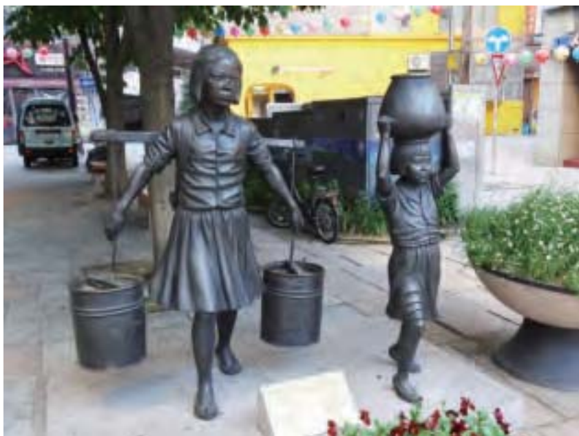
40階梯文化區銅像雕塑，韓戰期間艱困生活供水不便，婦女們必須自己打水回家使用。

如：天空中的天使、彩色骰子、穿著多彩衣的人們、打棒球、冰淇淋、海底世界、天空中的氣球、彩色城堡、下雨了……壁畫多以兒童、自然為主，兒時記憶此時此刻似乎被喚起，在巷弄間感受童年純真信息。