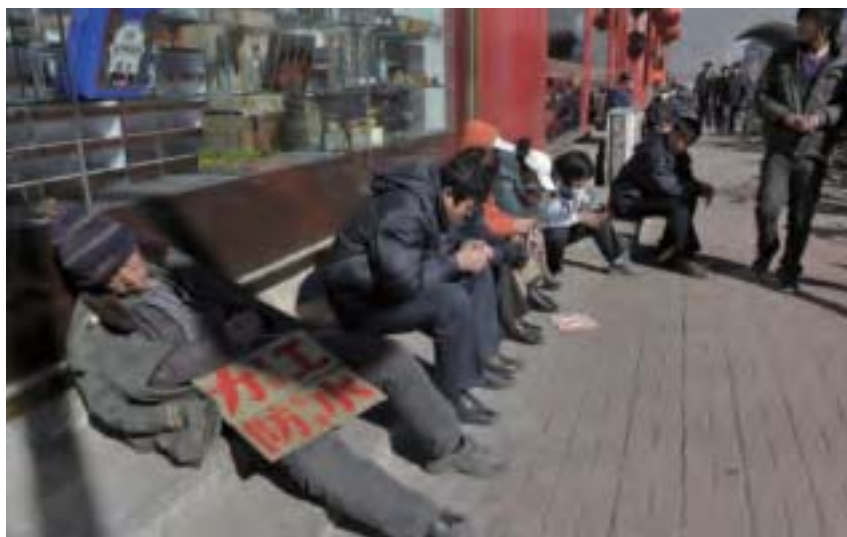
近年東北三省在全國GDP增長的排名中都是最後墊底的，2015年遼寧還出現了全國唯一的負增長。圖為瀋陽街頭招攬工作的工人。

2016年5月，習近平、李克強相繼到東北視察。若論資源之豐富，產業之堅實完整，起步點之高，全國無一地區能與東北媲美，