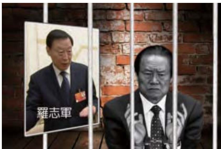
江蘇幫積極迫害法輪功的惡人，大多被當局抓捕和查辦，但還有很多尚未落馬、隨時可能被抓，與江澤民關係匪淺的羅志軍，因涉嫌捲入周永康和令計劃集團，前景不妙。

如今習近平在安徽、江蘇同時動手，反腐攻勢凌厲。有陸媒報導說，王岐山的目標並不是這兩個副省長，習、王在「下一盤更大的棋」，甚至可能有更大的「老虎」被打被拿下。✘