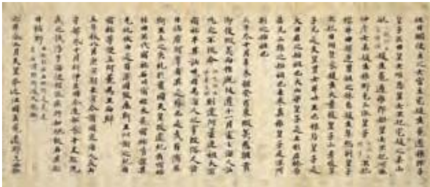
日本正史《日本書紀》中記載了隋日兩國互通使節的歷史事件。圖為《日本書紀》平安時代抄本。

天皇的支持下，進行政治改革，並借用儒學的道德觀念、陰陽五行學說的自然規律理論闡明王權、君主制度的合法性。