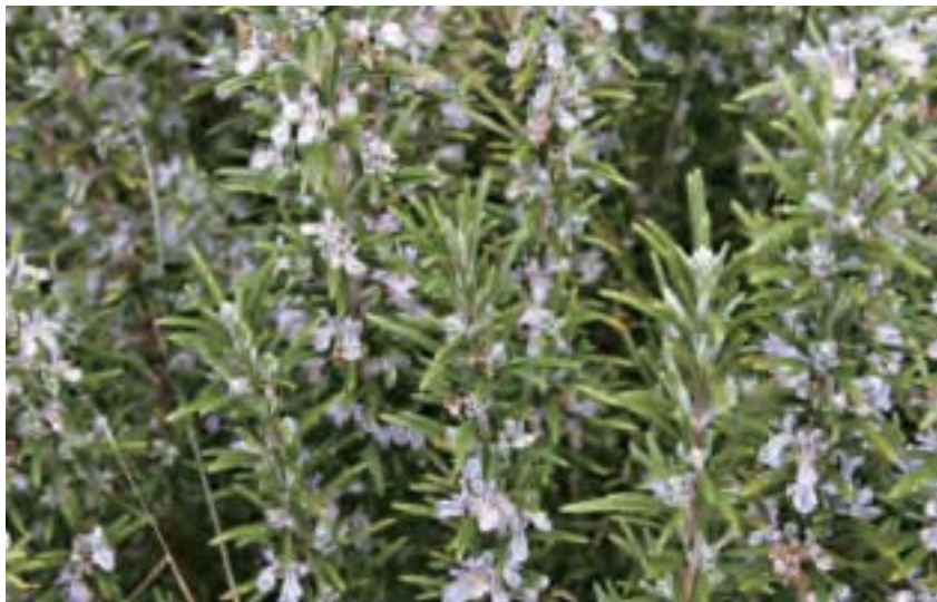
廚房適合擺放迷迭香，促進消化、增強身體免疫力，還可入菜。在烹煮肉類時加入迷迭香，能減少60~80%致癌物質雜環胺的釋出。