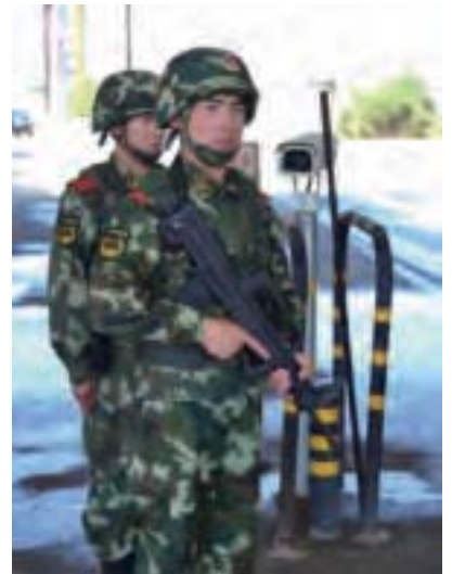
2016年5月底，大陸31個省動用數十萬武警在北京方向及重點方向舉行大規模演練，幾乎動用中共武警部隊人數的一半，如此高規格的演練「極不尋常」。(AFP)

轉而倚重武警，並為此花費了巨大精力和金錢。武警在此時期得到迅速發展，一度被海內外呼為「江家軍」。