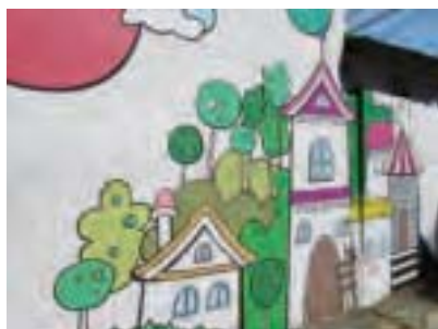
門峴洞壁畫村壁畫。