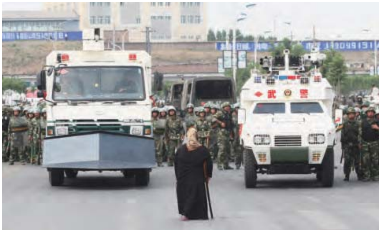
周永康接替中共政法委之後，各地民衆抗暴維權事件不斷，武警成為江澤民集團迫害民衆的暴力武裝。圖為2012年7月7日烏魯木齊民衆抗暴。

銜，使武警司令員的級別與七大軍區的司令員同級別。1999年新年，時任中央軍委主席江澤民視察武警北京市總隊十一支隊，從此中共加大了對武警部隊的扶持。