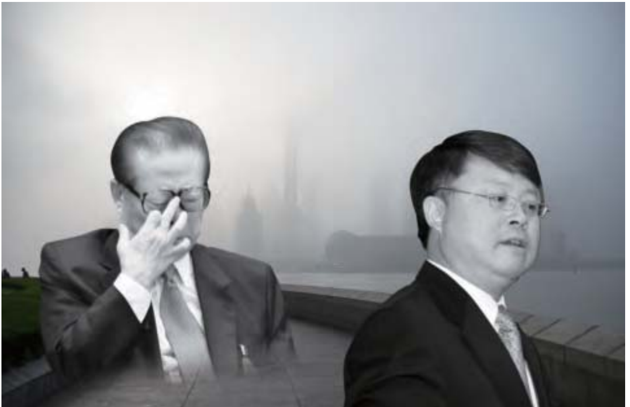
近期，江澤民、江綿恆父子被軟禁的消息被傳出。敏感時期，習陣營密集動作震懾上海官場。