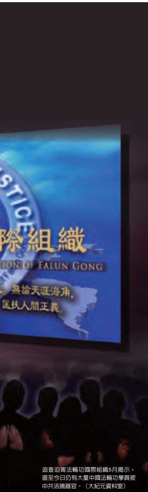
追查迫害法輪功國際組織5月揭示，直至今日仍有大量中國法輪功學員被中共活摘器官。(大紀元資料室)