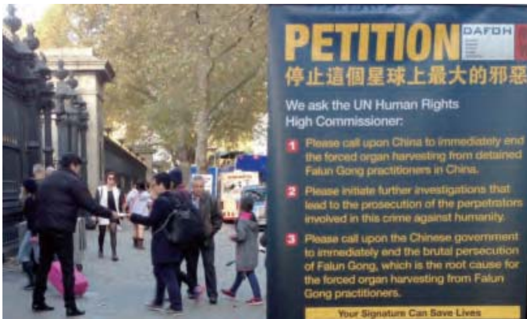
大英博物館（British Museum）前的遊客駐足觀看法輪功真相展板。

需要我關照，在中國，我和親戚們及自己的家族關係都很好；我的鄰居們都很好，朋友也很多，我有一個很大的很舒適的生活環境。我捨不得真的離開他們。