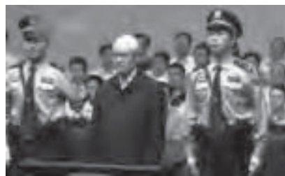
王立軍事件爆發、薄熙來尚未出事，前，《新紀元》即開始預言周永康必然會遭到逮捕。2年5個月之後，周永康正式被捕。（資料圖片）

後來中共官方公布免除薄熙來重慶市委書記一職的時間是3月15日，也就是說，《新紀元》的預測領先了一個月。