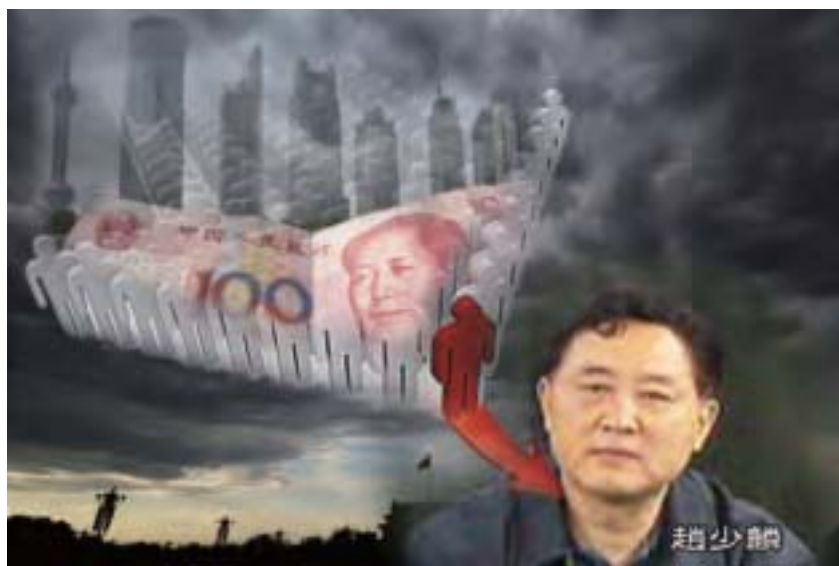
趙少麟案牽出的團團伙伙，大肆進行利益交換，彼此形成幫派，互相勾結、互相庇護。