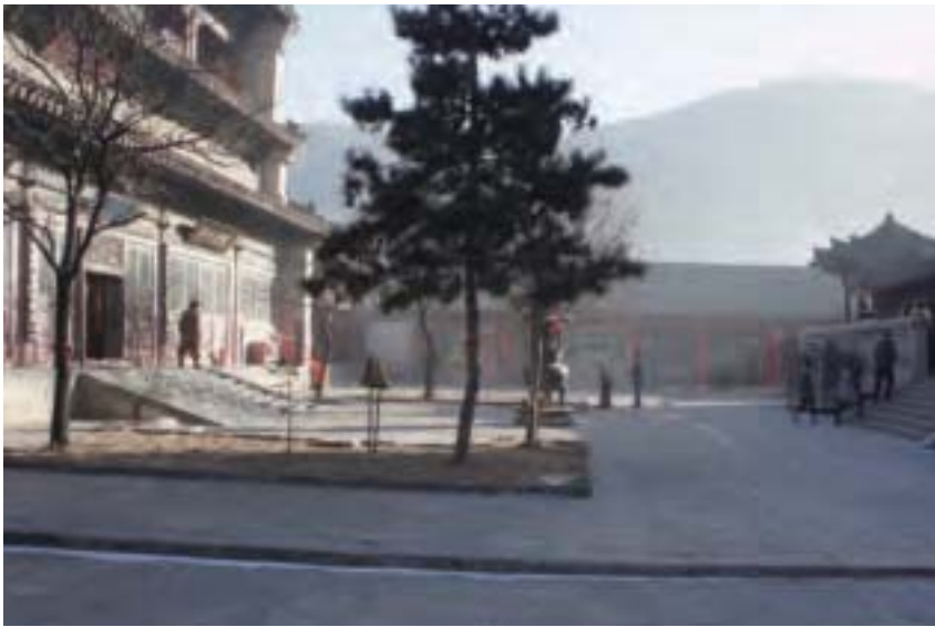
1944年春天，五台山和尚曾預示張善緣家族老人躲避「文革」浩劫及大饑荒。圖為五台山寺廟。