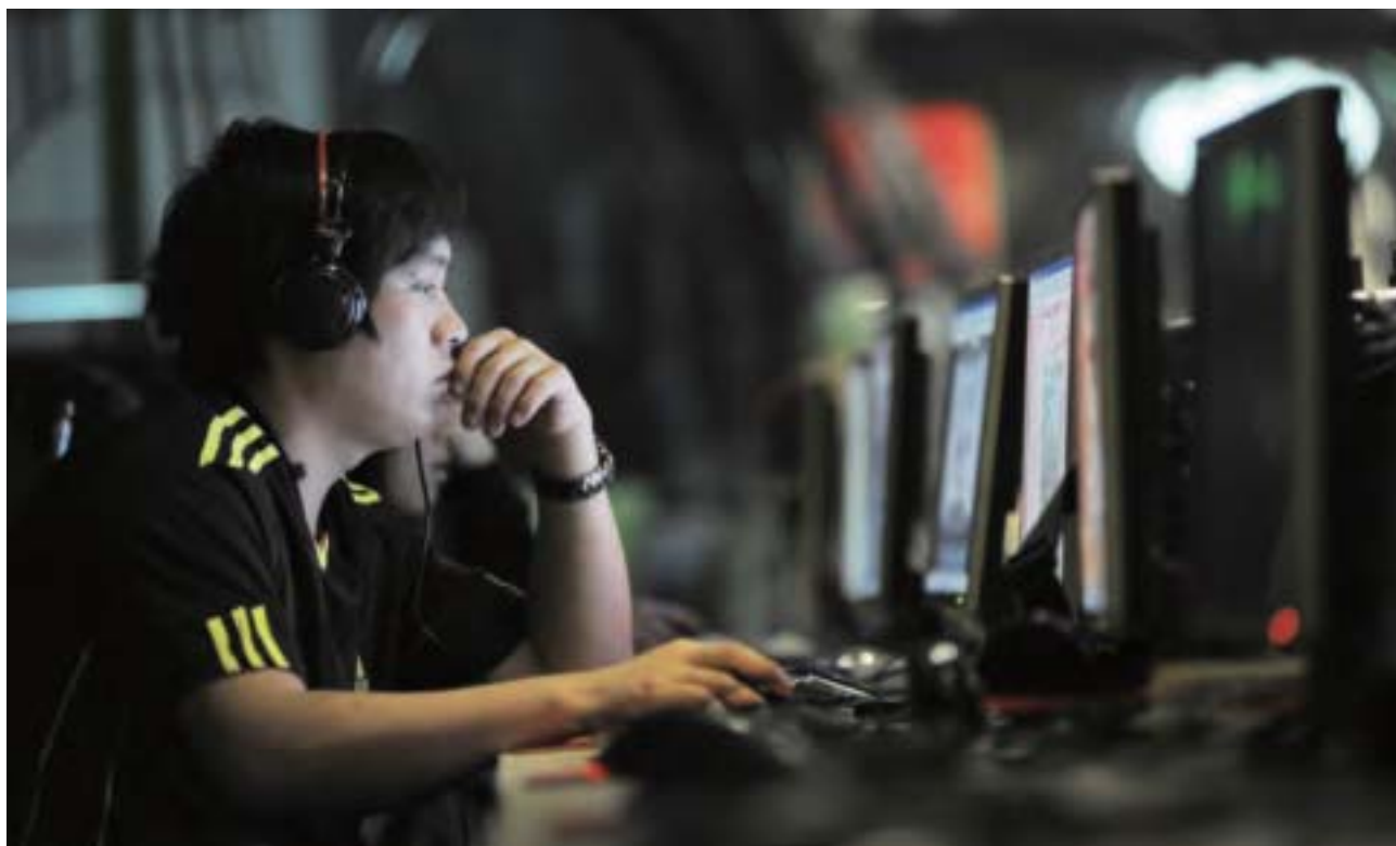
據《新紀元》總編輯臧山表示，網路封鎖本質上是信息壟斷和控制，對共產專制的治國者來說，封鎖是不能有漏洞的，要求共產黨開放網路，實際上是與虎謀皮。