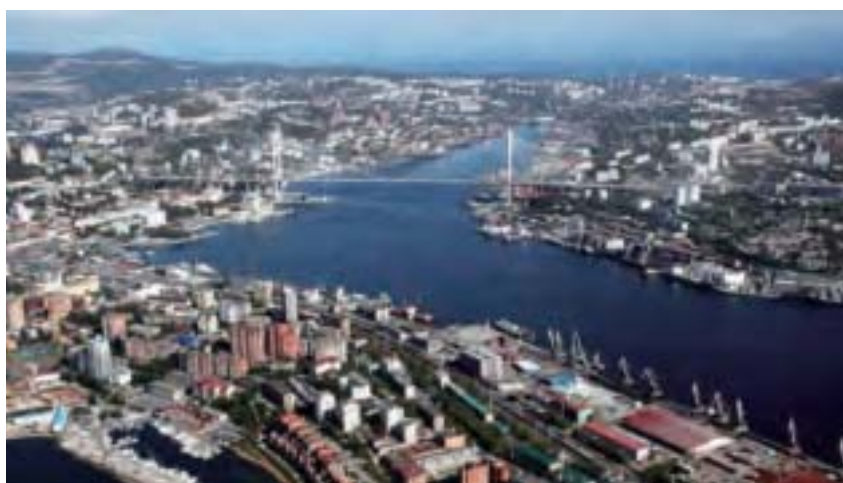
海參崴是蔣介石誓死力爭的重要海港，被江澤民出賣給俄國，斷了中華民族生存發展的後路。

而事實上，海參崴，即符拉迪沃斯托克，原來是中國的固有領土，後來被俄羅斯侵占。二戰結束，中華民國政府曾和當時的蘇聯