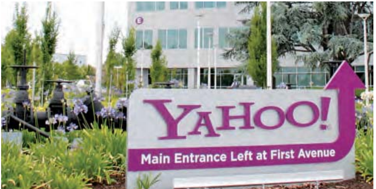
總部設在舊金山南灣桑尼維爾市的雅虎，曾創造互聯網經濟奇蹟。

在經歷裁員、營收和股價雙重暴跌後，雅虎於4月18日在美國加州桑尼維爾接收競價收購。