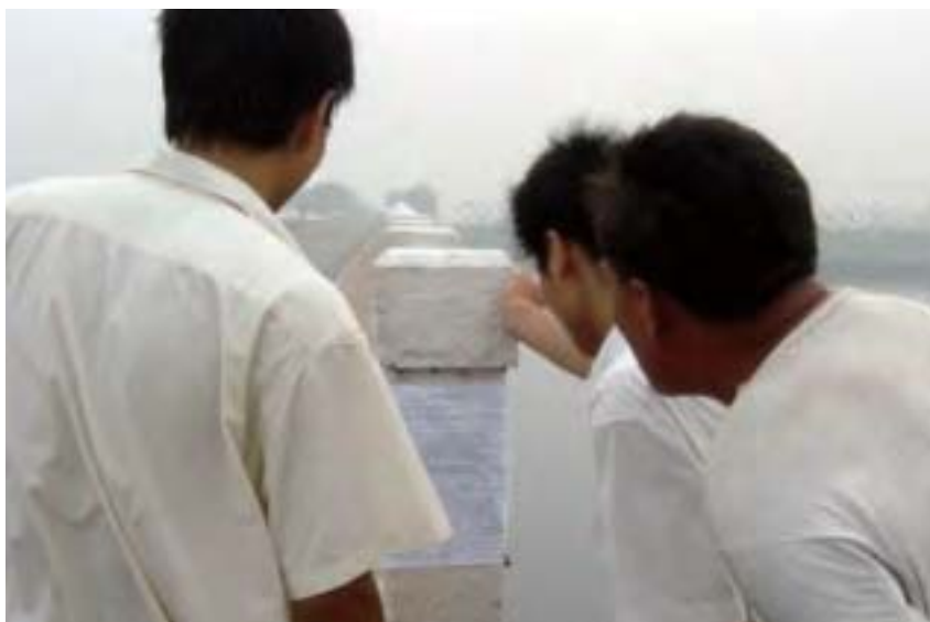
據明慧網2005年7月30日報導，北京、天津、河北保定石家莊等地各界正義之士巧妙傳遞《九評》及退黨資訊，見者欣喜，口耳相傳。（明慧網）

在煉功過程中我的感覺很明顯：盤腿打坐大約十分鐘後，我右腿大腿處噲噲地往外竄涼氣，好像大腿裡面有機器有動力一樣，不停的往外排涼氣，接著我的後背熱起來了，隨後腦袋出汗了，大汗濕透了所有的頭髮，那種感受非常奇特，就像美國電影描述的體內巨變一樣，我當時汗流滿面，但心裡覺得很舒服很興奮，就這樣堅持打坐。神奇的是，等我煉完這一小時打坐，我的腿疼、腰疼、肩周炎、手麻木、頸椎增生、高血壓、視疲勞等疾病立即不翼而飛，就像脫胎換骨一樣，我一下變成了一個新人！師父快速的把我從病痛中解救