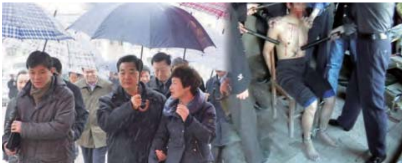
江蘇官場之所以動盪得這麼大，還與江蘇鹽城兩位高幹子弟給胡錦濤和習近平的公開信有關。左圖：為胡錦濤親赴鹽城了解情況。右圖：中共對法輪功學員實施的酷刑。