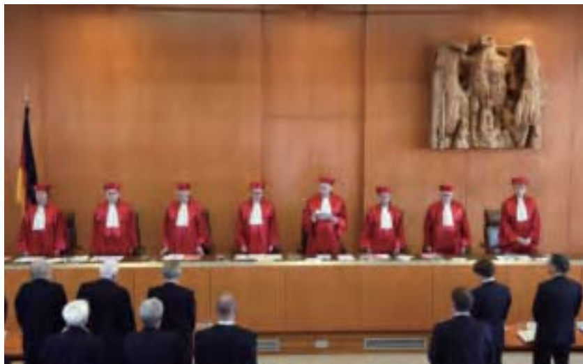
弗里德里希認為獨裁是對於民主的一種自然的補充，而這種憲政獨裁思想的核心標誌是，它只能是為了合法的目的才能啟動。圖為德聯邦憲法法院