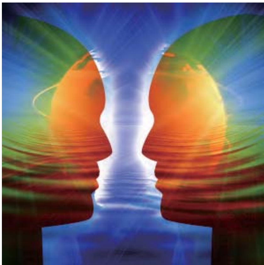
澳大利亞的科學試驗證實，人的直覺是存在的，而且有時比其他思維方式具有更準確的判斷力。