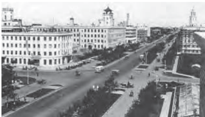
1944年長春人口達到121.7萬人，超過東京（都市區），號稱亞洲第一大都市。（公有領域）