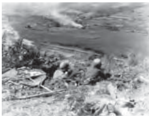
一隊美軍士兵駐守在釜山環形防禦圈的洛東江河畔，準備阻止朝鮮人民軍的進攻。（公有領域）