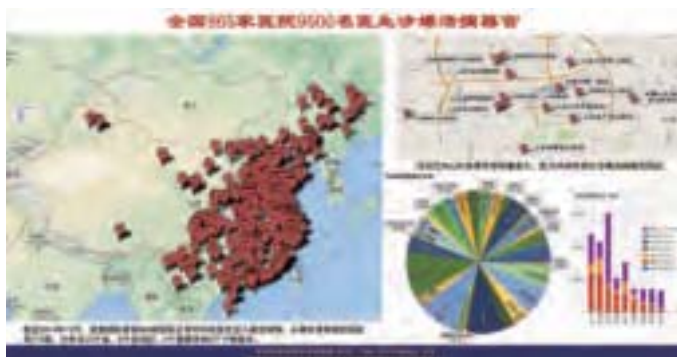
追查迫害法輪功國際組織透過對中國865家開展器官移植的醫院追蹤，以及對9500多名移植執業醫生的調查，揭示中國存在著龐大的活人器官供體庫的證據。