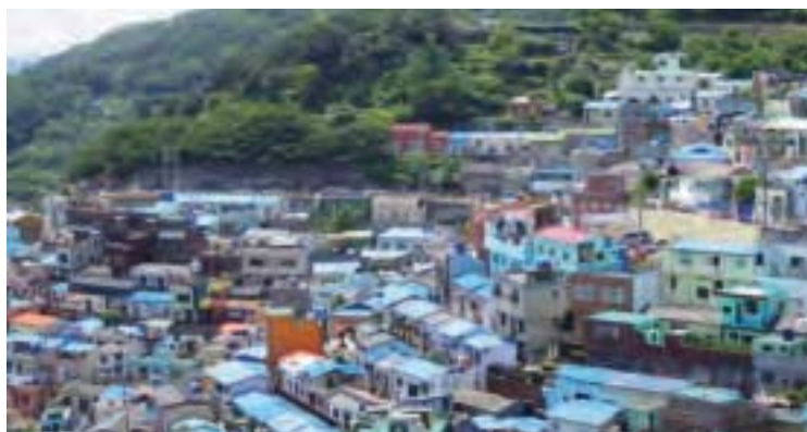
甘川文化村，五顏六色的彩繪房子像「韓國馬丘比丘」。