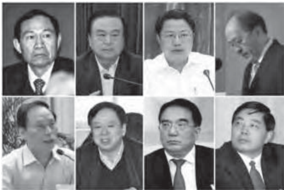
2016年以來，習近平當局打虎速度不斷提升，最近3天密集有17名官員落馬。自左至右上排為：陳雪楓、武長順、楊衛澤、肖天；下排為：斯鑫良、王陽、王珉、仇和。（大紀元合成圖）

「六四」紀念日前夕，習王當局3天共查處17名官員，其中河南、廣東、湖北、吉林、河北共6名官員被調查，前河南省洛陽市委書記陳雪楓、前遼寧省人大副主任王陽等「二虎」被「雙開」；重慶、哈爾濱、中石油重慶公司的4名官員被「雙開」或開除黨籍；仇和、楊衛澤、武長順、斯鑫良、肖天「五虎」被提起公訴。被處理的「七虎」大