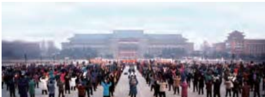
1992年5月，李洪志先生在長春首次公開向全社會傳授法輪功，法輪功在長春深入人心。圖為迫害之前，長春學員在長春地質宮前煉功的壯觀場面。

上天是厚待東北人的，法輪功的創始人李洪志先生就出生在吉林長春，法輪功最早就在東北三省傳出，1999年學煉法輪功的人數比例東北也是全國最高的省分。然而，自從1999年7月江澤民集團違背中國憲法，悍然發動對法輪功的鎮壓