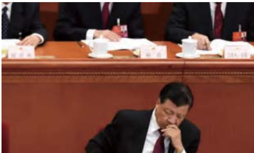
主管中共文宣系統的政治局常委劉雲山深涉三重政變罪行。最近，五名政治局委員聯署彈劾劉雲山。

1. 審查期間，暫停劉雲山的中共政治局常委、政治局委員、中央書記處書記、中央黨校校長、中央精神文明建設指導委員會主任等職務。