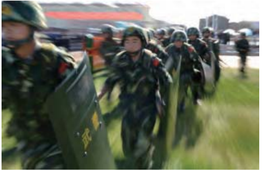
5月24日至29日，大陸有31個省動用數十萬武警在北京方向及相關重點方向舉行連續實戰進程演練，跡象顯示，將有更大的「老虎」被拿下。

5月中旬，中南海通過海外中文媒體釋放消息稱，王岐山在4月29日中共政治局會議上對此放出「重話」稱，反腐敗鬥爭的「攻堅戰」已經打響，時間已經不允許遲緩及妥協，並強硬聲明，這次要「動真格、設時限啃下硬骨頭，在19大前夕見分曉。」