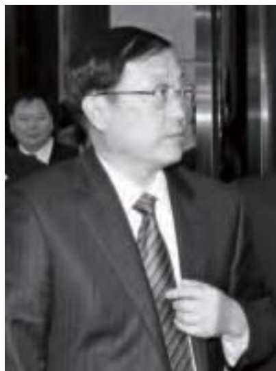
陳政高被傳是王岐山口袋中隨手可拋的一隻正部級「老虎」。圖為2011年2月20日陳政高訪臺一路遭遇抗議。

5月31日和6月1日，有一中央部委被財新網連續點名，那就是住建部（住房和城鄉建設部）。報導事由，住建部涉一起民告官的訴訟，但案子敗訴後又拒不執行法院判決，輿論譁然。