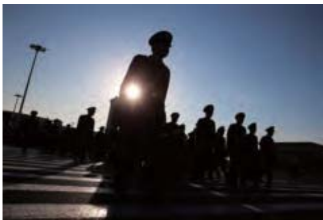
專家指出，習近平對江蘇官場江派勢力的全面清除，是在爲最後對江澤民採取措施掃清障礙。（大紀元合成圖）

時政評論員方林達表示，習近平對江蘇官場江派勢力的全面清除，是在爲最後對江澤民採取措施掃清障礙。✘