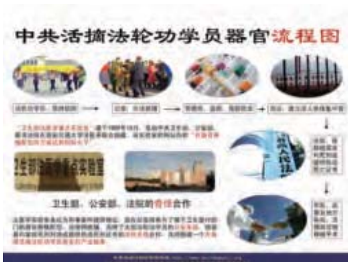
中共活摘法輪功學員器官流程图。

1999年後中國器官移植產業爆炸性增長與中共迫害法輪功的時間同步，並呈現其獨有的特徵，移植器官之種類繁多、規模之大、等待時間之短和移植器官質量之佳、器官之鮮活等特徵，都指向其必要條件——器官的反向配型和基數巨大的活人供體庫的存在。