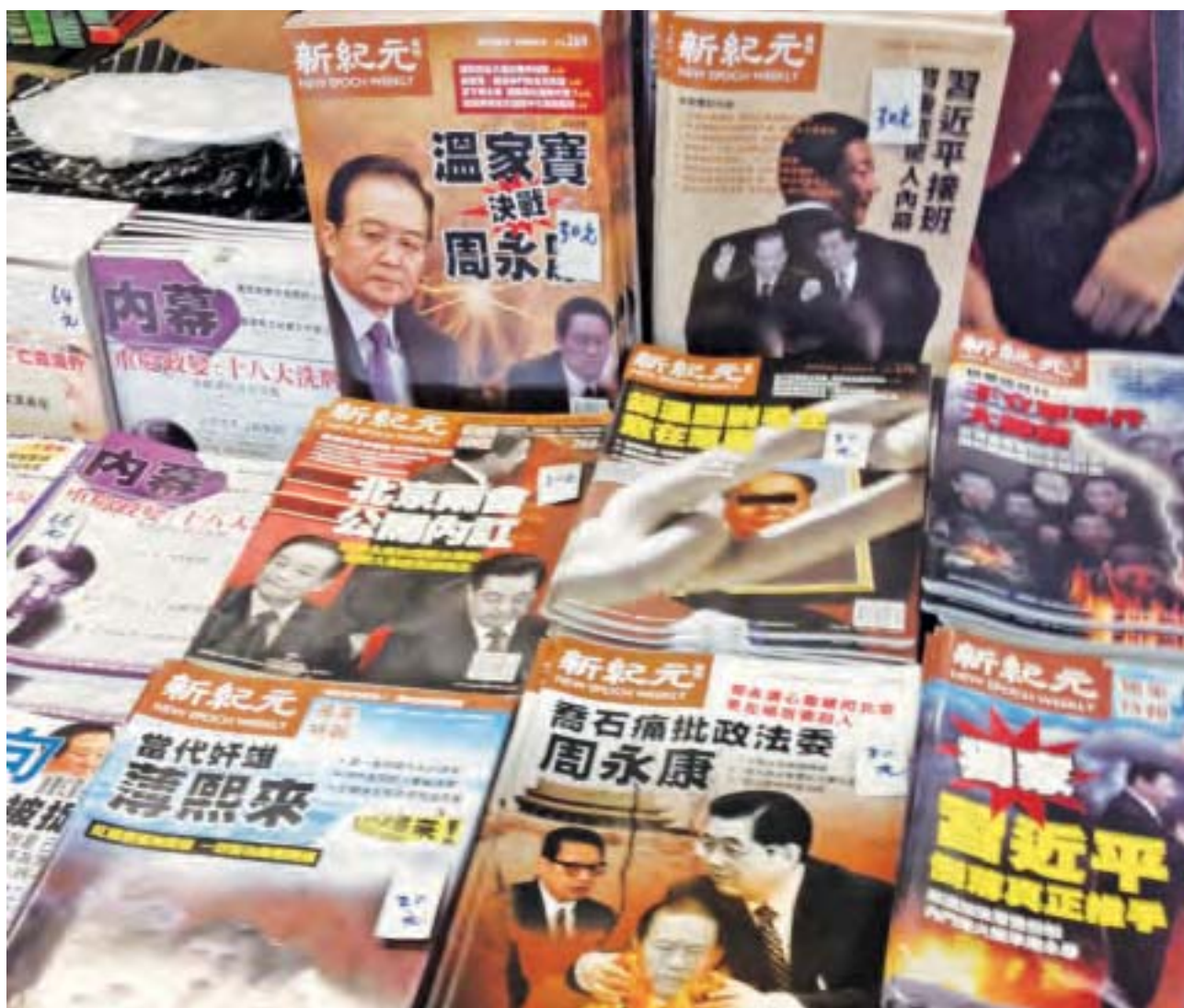
自2012年11月習近平上臺迄今三年多來，《新紀元》對於中國政局的判斷是相當準確的。圖為香港書報攤上的《新紀元》雜誌及叢書。