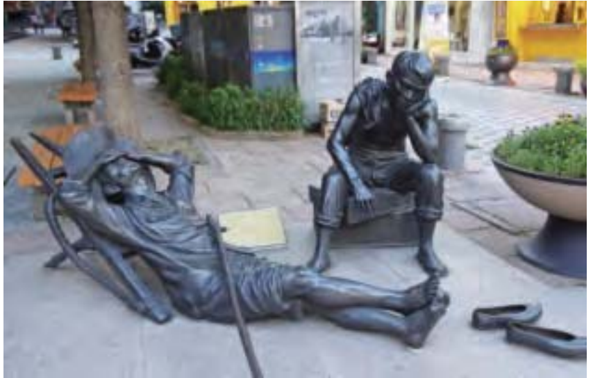
40階梯文化區辛勞的人們在路旁暫時休息片刻。

違反聯合國協議三八線，大舉派兵南下，三天內占領韓國首都漢城（首爾舊稱）。再加上中共欺騙許多中國人成立百萬「中國志願軍」到北韓支援攻打韓國，蘇聯也出動空軍轟炸韓國，韓國節節敗退，向