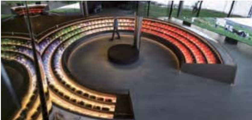
瑞士的實驗結束了，地球人的實驗也即將收場。圖為蘇黎士一博物館內部。

文 _ 謝田 _ 美國南卡羅萊納大學艾肯商學院講座教授 John M. Olin Palmetto Professor in Business University of South Carolina Aiken