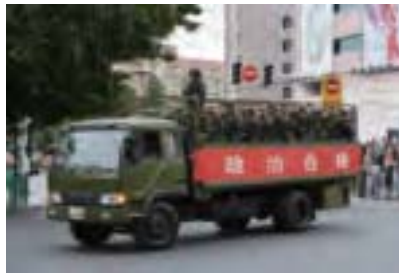
過去十多年，江澤民耗費巨資將武警發展成「第二權力中央」的武裝力量，藉「維穩」名義鎮壓民衆，並多次參與政變。通過不斷的清洗，目前習當局已基本掌控了武警部隊。

習近平上任後，開始不斷清洗武警部隊，其中僅武警交通指揮部就有4名將軍先後落馬；同時對武警總部及多省武警總隊高層人事進行不斷調整，僅2015年，武警總部有4名副大軍區級高級將領轉任新職，多省市武警總隊負責人被調整。