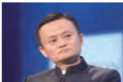
傳聞阿里巴巴馬雲在內部講話透漏對互聯網的未來有莫測的恐懼。

不換，但是如果馬化騰要跟我換，我得想一想。馬化騰已經拿到移動互聯網的站臺票，即使馬雲，都有對未來莫測的恐懼。」