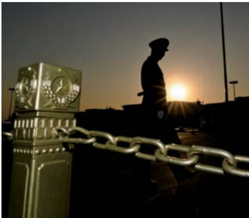
習近平在掌權之初雖不克實現真正的改革，但也絕不會聽任江派垂簾擺布，替其背黑鍋，他會以反貪腐的方式肅清江派。