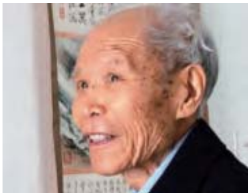
前中宣部理論局副局長李洪林倡導文化、觀點和思想解放，反對個人崇拜，遭「左王」鄧力群貶黜。後因支持「六四」學生而被囚禁近一年並失去官職。（資料圖片）

李洪林曾先後在中央政治研究室、歷史博物館工作。胡耀邦因喜歡李洪林的〈科學和迷信〉一文，點名把李洪林調到中宣部任職。李洪林倡導文化、觀點和思想解放，反對個人崇拜、迷信領袖。80年代初，