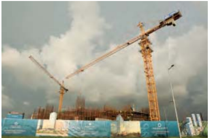
2013年，中共提出14億美元的科倫坡港口城市計畫。圖為2015年10月15日，中國公司在科倫坡港口建酒店的施工工地。

美國外交政策理事會（American Foreign Policy Council）亞洲安全項目主任史密斯（Jeff M. Smith）日前在《外交事務》上發表了一篇文章，中共投資的項目已經使斯里蘭卡陷入債務，重新點燃了中共和印度的競爭，令人懷疑北京使用經濟方式在斯里蘭卡推進戰略目標。