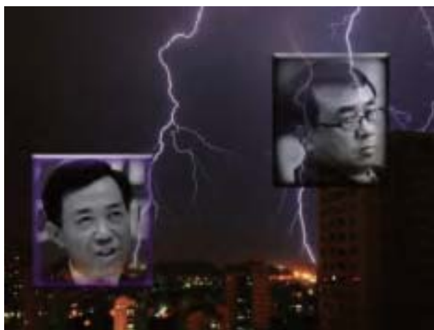
王立軍事件爆發後，《新紀元》領先了一個月預測薄熙來仕途從此斷送、乃至被捕下獄。

終於，中共官方在2014年7月29日傍晚時正式宣布逮捕周永康。本刊的預測領先了2年5個月。