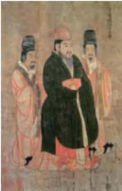
隋煬帝（左）與日本聖德太子（右）畫像。（公有領域）