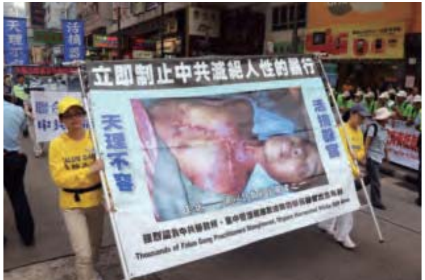
自從中共活摘法輪功學員器官的消息被報導後，各界人士紛紛呼籲制止迫害。圖為2012年10月1日香港法輪功學員遊行揭露中共活摘器官的罪行。

中共體制下的死囚處決也得按一定的司法程式，需要最高法院批覆和按規定的時間處決，所以死囚犯的數量不可能滿足大量突發的急