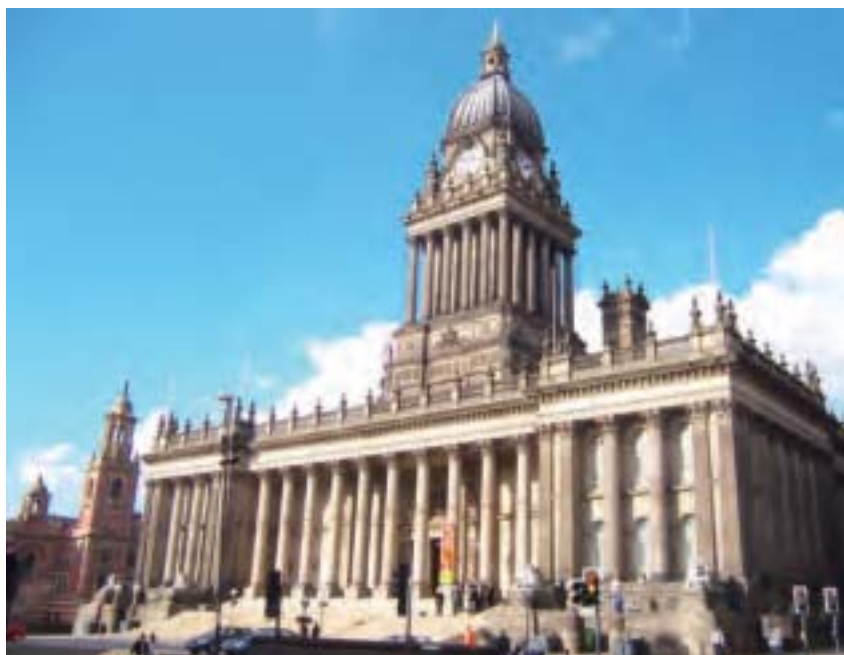
英國利茲市政廳。

覺我的心和眾生得救緊緊相連。開始我不會說英語，就把「Your signature can save life.」（你的簽名可以拯救生命）這句話寫在小紙牌的反正兩面。我一邊學著說英文，一邊拿著小紙牌讓眾生看，很多眾生豎起拇指鼓勵我，就這樣很多人都來簽名。