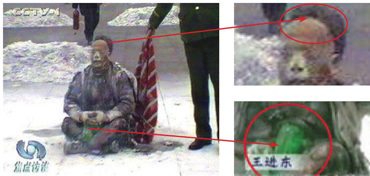
警察晃着灭火毯等镜头 火烧后塑料瓶完好翠绿

■ 穿帮之一： 开水一烫就变形的塑料瓶，竟在大火之后不变形，棉衣和裤子烧烂烧黑，它却依旧翠绿！