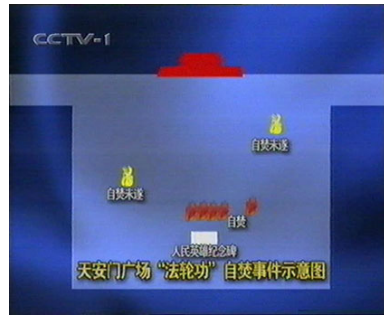
圈套的自焚位置图