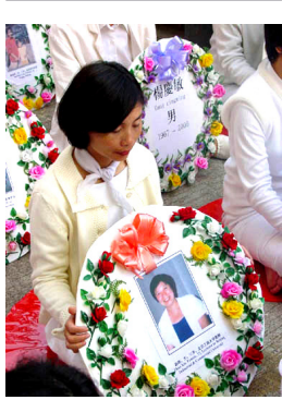
海外悼念被迫害致死的大陆法轮功学员。