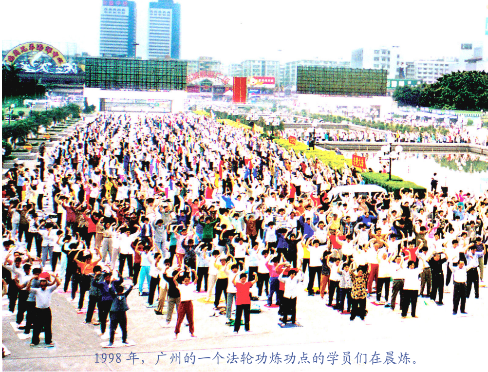
1998年，广州的一个法轮功炼功点的学员们在晨炼。

据当时中国公安内部调查，从1992年5月至1999年7月的7年间，中国大陆炼法轮功的人数达到7千万至1亿，超过共产党员的人数。法轮功在极短时间内的迅速传播，使“假恶斗”的中共和对权力极端偏执却又贪腐无能的江泽民本能地产生嫉妒和恐惧。