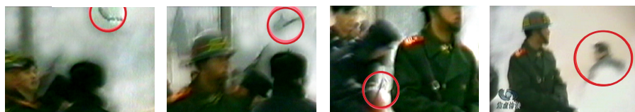
警察盯着凶器落下，摄像机左移