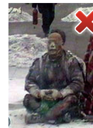
盘腿动作完全不同