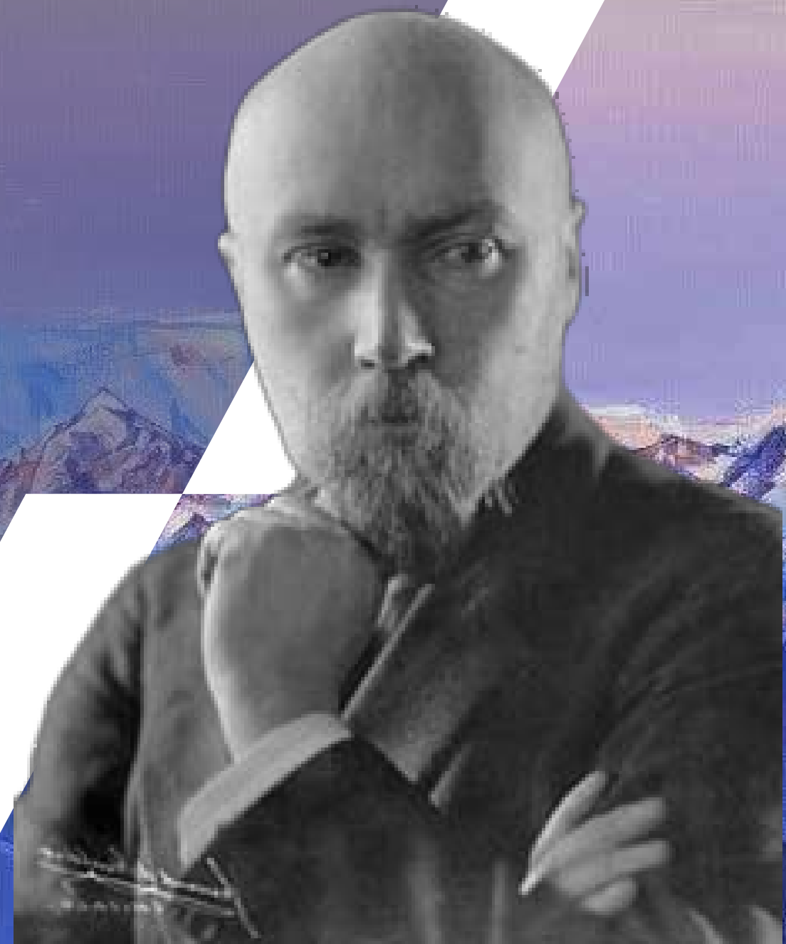
Н. К. Рерих

Погрузитесь в историю и культурное наследие Алтая с нашим уникальным авторским туром «Путь Рериха», приуроченным к 100-летию Российского этапа Центрально-Азиатской экспедиции! Рерих верил, что Алтай обладает особой энергетикой, которая помогает человеку обрести внутреннюю гармонию и духовное просветление. Он писал о том, что каждый, кто посетит этот край, сможет почувствовать связь с высшими силами и понять истинный смысл своего существования