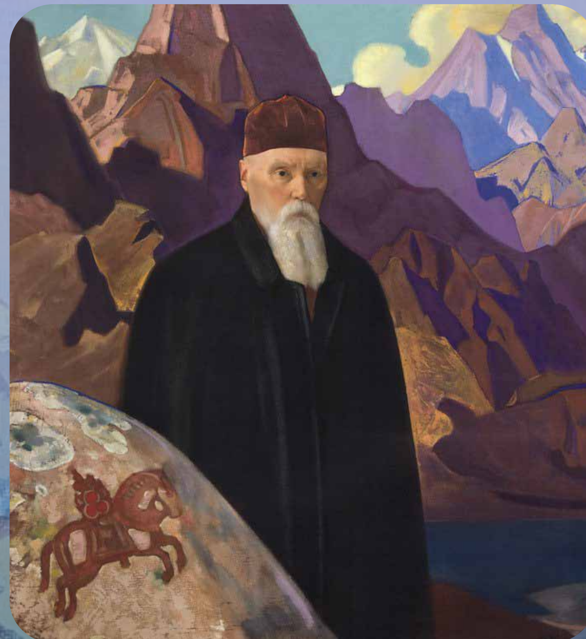
1937-1939 гг. Холст, темпера. 133 x 118 см. Национальная галерея зарубежного искусства. София, Болгария https://sibro.ru/photo/svyatoslav-roerich-portrety/