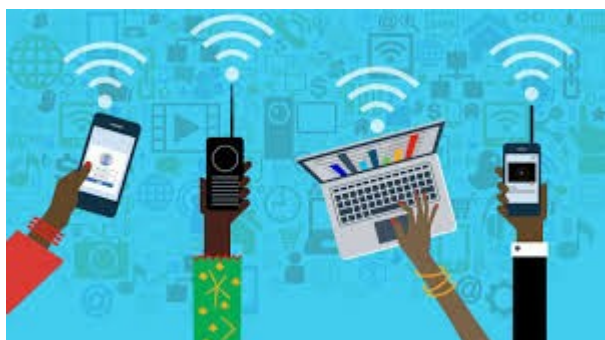
access to the internet

He posted a video online. He had access to the internet.