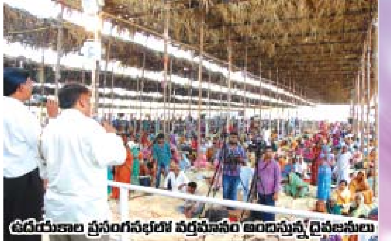
ఉదయకాల ప్రసంగసభలో వర్తమానం అందిస్తున్న దైవజనులు