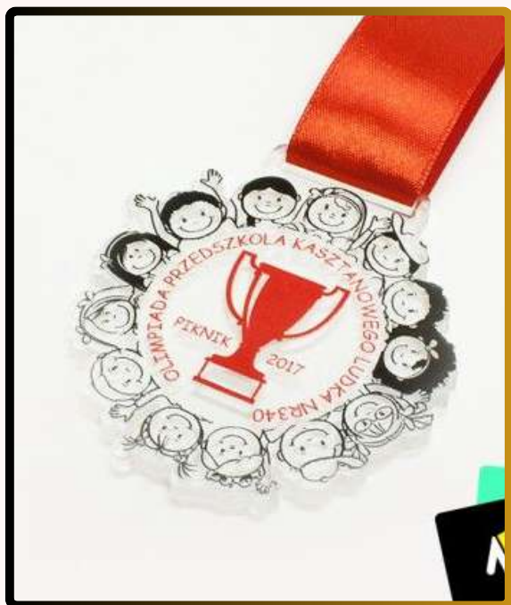
MEDALLA M-15 100% PERSONALIZADO