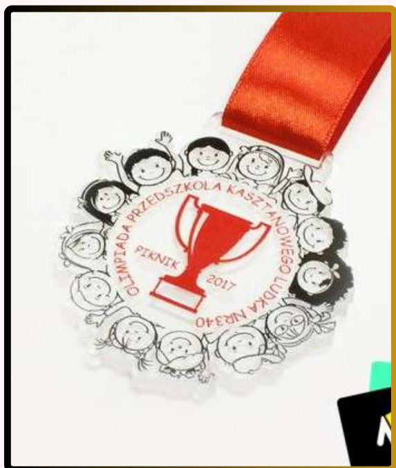
MEDALLA M-15 100% PERSONALIZADO