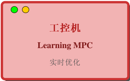
工控机 Learning MPC算法核心 IP: 192.168.1.100