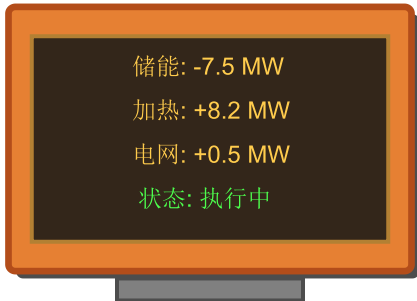
PC-3 执行器 设备控制 IP: 192.168.1.30