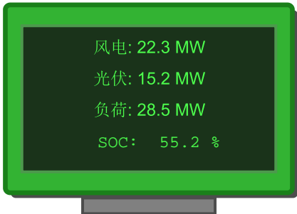
PC-2 仿真模型 数据模拟 IP: 192.168.1.20