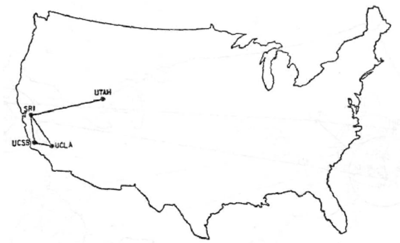
A ARPANET no início, em 1969, só tinha 4 pontos

Em 29 de Outubro de 1969 ocorreu a transmissão do que pode ser considerado o primeiro E-mail da história . O texto desse primeiro e-mail seria "LOGIN", conforme desejava o Professor Leonard Kleinrock da Universidade da Califórnia em Los Angeles (UCLA), mas o computador no Stanford Research Institute, que recebia a mensagem, parou de funcionar após receber a letra "O".