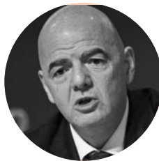
Gianni Infantino président de la Fifa

« Merci d'organiser la plus belle Coupe d'Afrique »