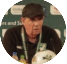
Jean-Louis Gasset, Sélectionneur de Côte d'Ivoire

«Il nous reste du travail, mais le primordial, c'est la victoire »