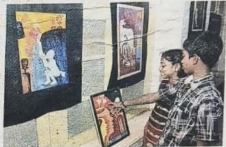
MOVING STROKES: Young visitors taking a look at the paintings in the exhibition in Tiruchi on Sunday.