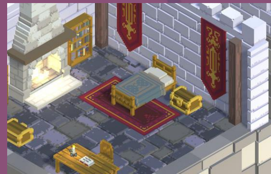
Voxel Castle Pack Lite