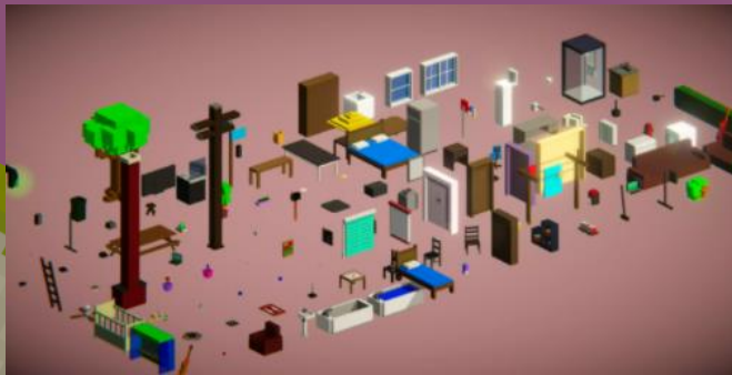
VOXEL Furniture FREE