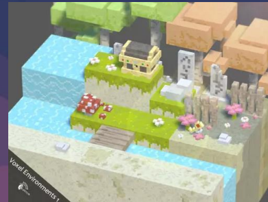
Voxel Environments 1