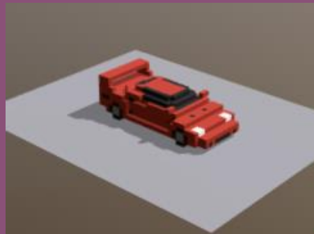
Free Low Poly Cubic Voxel Cars Model