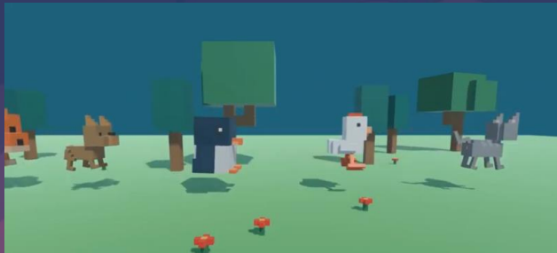
5 animated Voxel animals