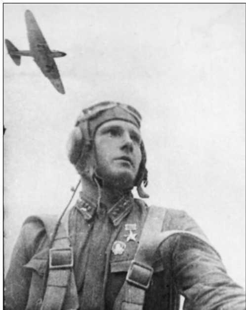
1942 год, Волховский фронт