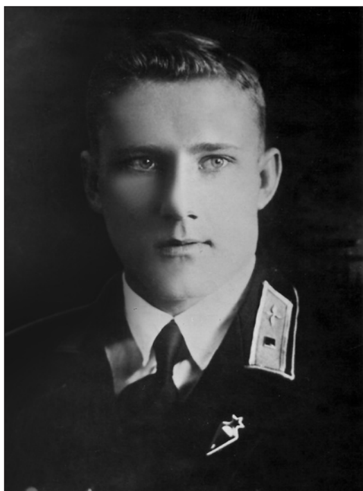
Годы учёбы в лётной школе, 1937 год