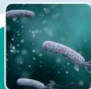
TTOS. PARA H. PYLORI