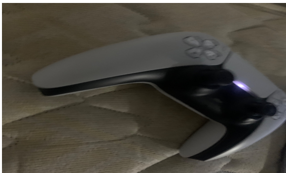
Foto No. 9. Control play