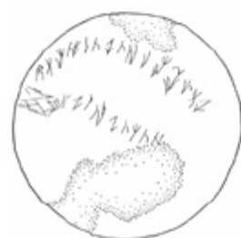
Есік қорғанынан табылған таңбалы күміс тостаған. Тостағандағы 26 таңбадан тұратын жазу.

табылған тостағандағы жазу сақтардың әліпбиі болғандығынан мәлімет береді. Табиғатты ерекше құрметтеген сақтар жануарларды «аң стилі» деп аталатын зергерлік бұйымдарда тамаша шеберлікпен бейнелеген. Сақтар туралы деректер ежелгі грек, көне парсы жазбалары арқылы жеткен. Деректерде сақтар ержүрек дала тұрғындары ретінде суреттеледі.