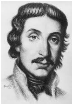
(Csokonai Vitéz Mihály)

A hatalmas szerelemnek Megemésztő tüze bánt. Te lehetsz írja sebemnek, Gyönyörű kis tulipánt!