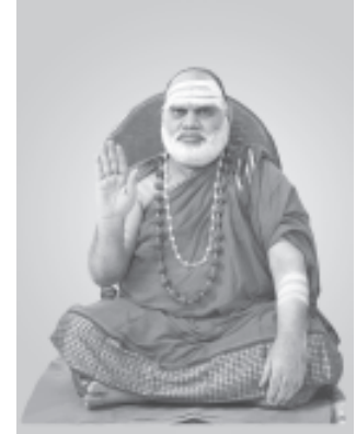
శ్రీజగద్గురు శ్రీ భారతీతీర్థ మహాస్వామి వారు శ్రీ శృంగేరి పీఠాధిపతులు