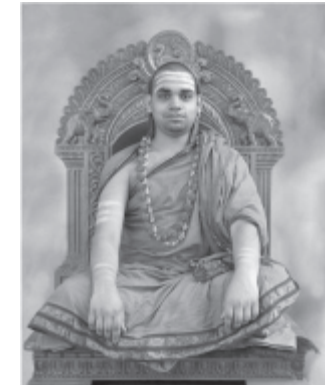
శ్రీజగద్గురు శ్రీ విధుశేఖరభారతీ మహాస్వామి వారు