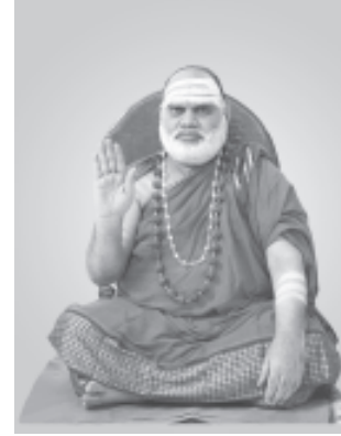
శ్రీజగద్గురు శ్రీ భారతీతీర్థ మేహోస్థామి వారు శ్రీ శ్యాంగేల పీఠాధిపతులు