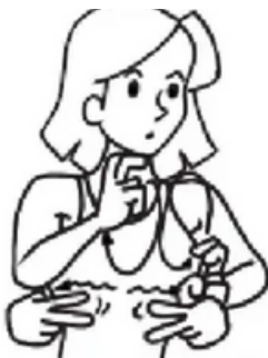
PARQUE DE DIVERSÃO