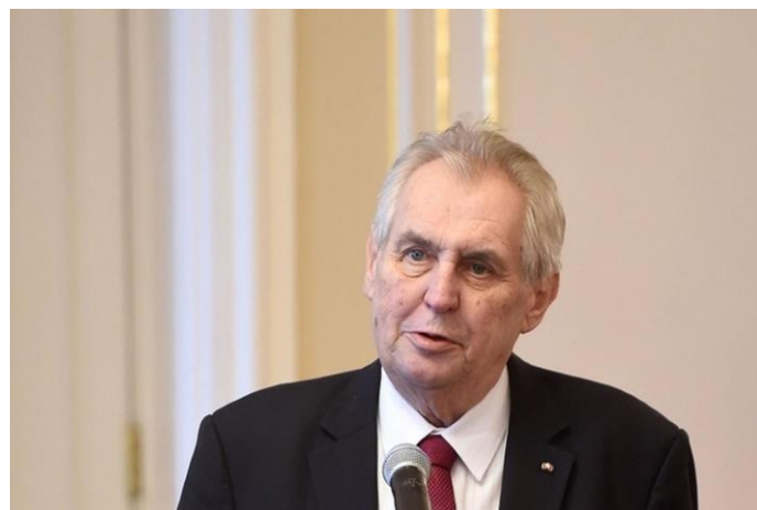
Miloš Zeman à Prague (27/01/2021)

Pour certains, le gouvernement ne fait pas l'unanimité. En effet, surtout cette année, étant donné que le président actuel Miloš Zeman est toujours au pouvoir, alors qu'il est gravement malade et ne peut pas prendre d'initiatives seul, actuellement. Certains Tchèques affirment que ce sont les personnes qui l'entourent qui veulent garder le pouvoir le plus longtemps possible en ne faisant pas de nouvelles élections.