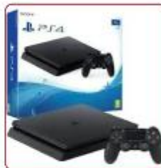
Play Station 4 1.500.000 COP