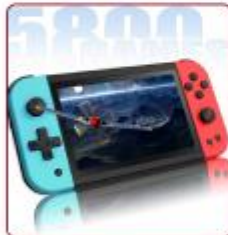
Nintendo Swich 1.000.000 COP