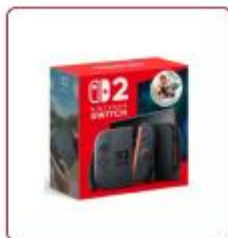
Nintendo Swich 2 1.600.000 COP