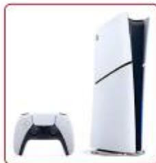
Play Station 5 2.500.000 COP