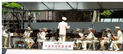
★千葉市消防音楽隊

★はしご車・化学車の大型2台展示。 ミニ制服着用・はしご車バケット試乗での写真撮影。