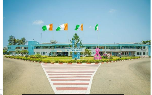
Le Chu de Treichville

C'est l'un des plus grands complexes culturels d'Afrique de l'Ouest et un symbole majeur de la vie artistique ivoirienne. Inauguré en 1999, est l'un des plus grands complexes culturels d'Afrique de l'Ouest. Il comprend plusieurs salles de spectacles, d'exposition et de conférence, dont la salle François Lougah, et accueille des événements culturels, artistiques et institutionnels de grande envergure.