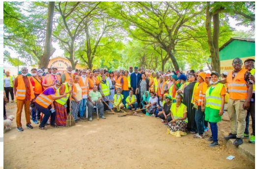
Le comité local de salubrité lors d'une de ses opérations mensuelles de nettoyage de la commune