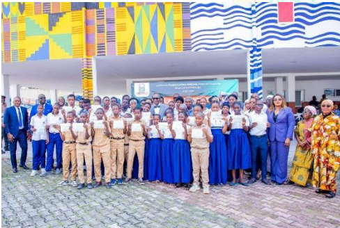
Remise de prise en charge aux élèves et étudiants de la commune