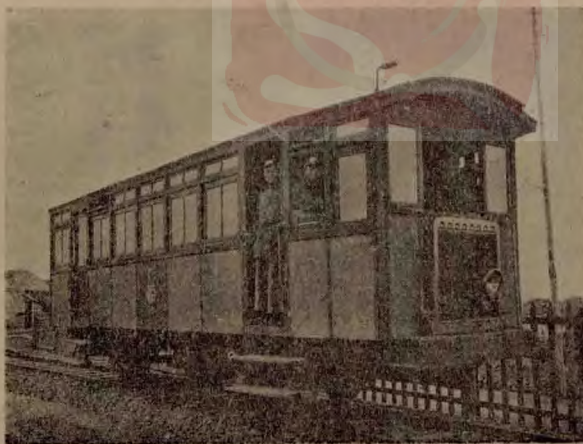
車汽軌有途長南上

浦東與浦西間。雖僅隔一水。而以對江渡船之未加改良。普設。拖駁各船之竄敗危險。行旅深感不便。故普設對江輪渡。實為浦江未經建橋以前。溝通兩岸交通。惟一之要圖。照最近統計。往來渡客每