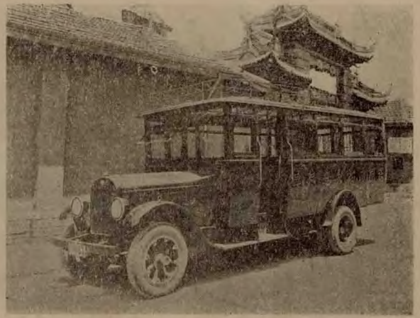
滬南閩拓長途汽車