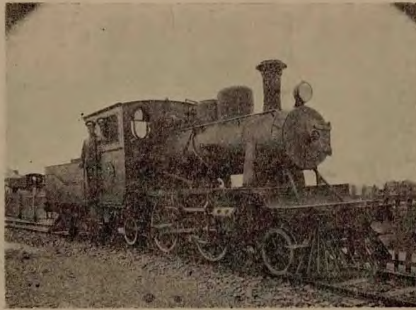
車火便輕之司公車汽途長南上 【者劃計行自德在者著文本係】

在世界各大都市。已漸次淘汰。蓋以精確計算。有軌電車。以重量過巨。故每載一客。須空拖五百磅之重量。無軌電車及公共汽車。僅有二百磅。經濟方面。相差甚巨。故為發展本市交通計。與辦無軌電車。實屬要圖。已由公用局擬就最新式六輪雙層之圖樣。令飭華商電