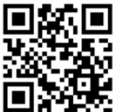
Fortbildung für Mentorinnen und Mentoren

Das Landesinstitut bietet ein umfangreiches Programm zur Fortbildung für Mentor:innen an, darin sind u. a. auch regelmäßige Treffen mit Seminarleitungen zum gemeinsamen Austausch vorgesehen.