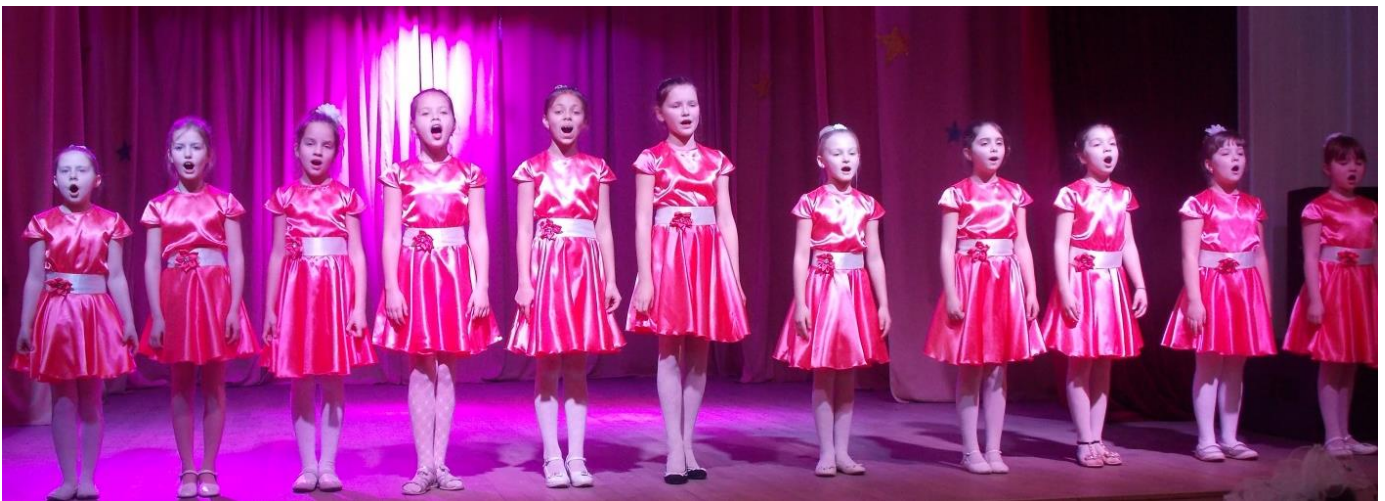
Вокально-хоровий ансамбль “Принцеси”