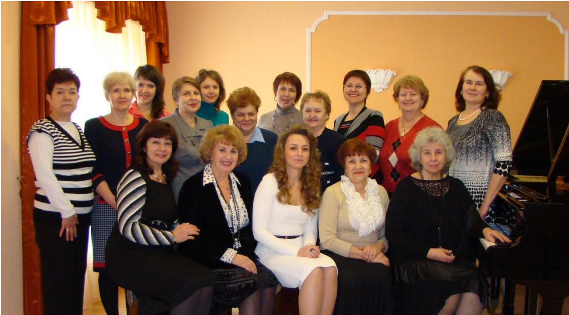
Викладачі фортепіанного відділу