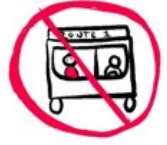
NU: Mergi cu transportul în comun