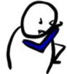
În mânăcă sau cot