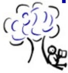
Mergi în locuri care nu sunt aglomerate