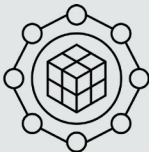
CODIFICACION TABLAS DE CUANTIFICACION