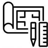
Revisión de planos 2D y Modelos 3D

El tiempo estimado de este proyecto esta proyectado para ser realizado en 3 Meses o 60 días hábiles , no se consideran días festivos o de asueto general dentro del tiempo.