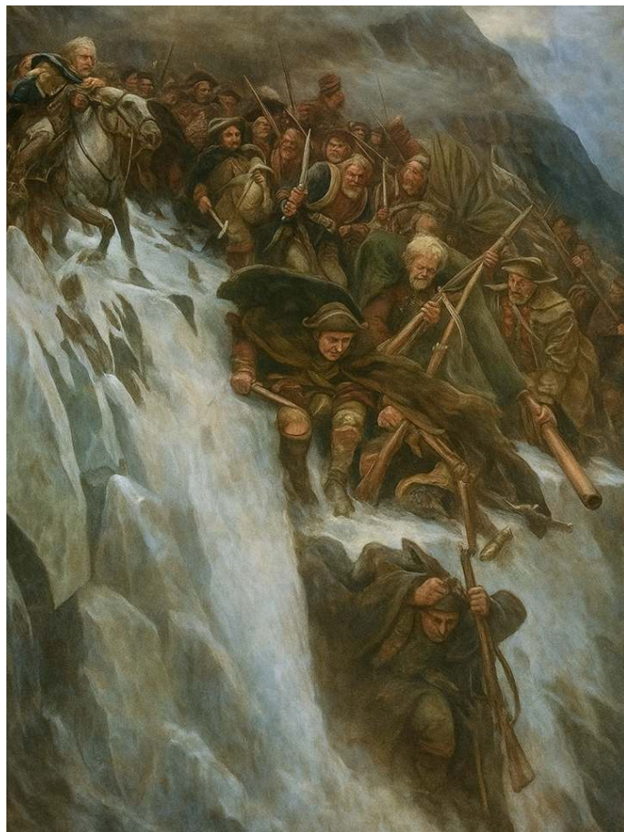
Переход через Альпы

По приказу императора Павла I армия под командованием Суворова