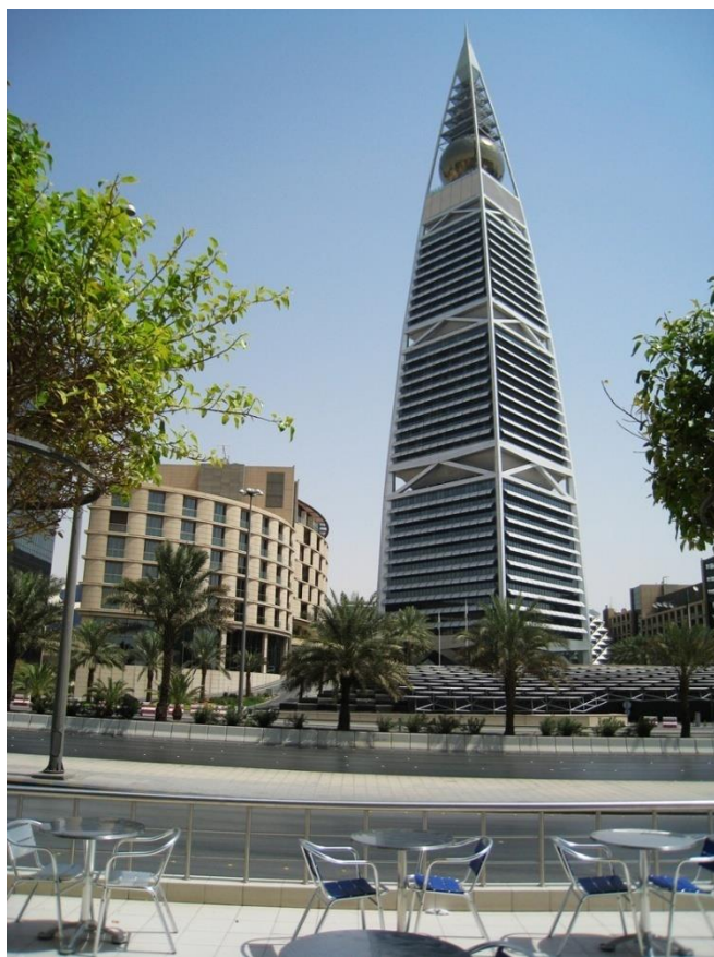
利雅得菲萨利亚塔

首都利雅得（Riyadh）是沙特第一大城市和政治、文化中心及政府机关所在地，位于沙特中部，城区面积1219平方公里，2019年，人口约723万，年增长率2.26%，其中沙特籍人口约占70%，外籍常驻人口约占30%。