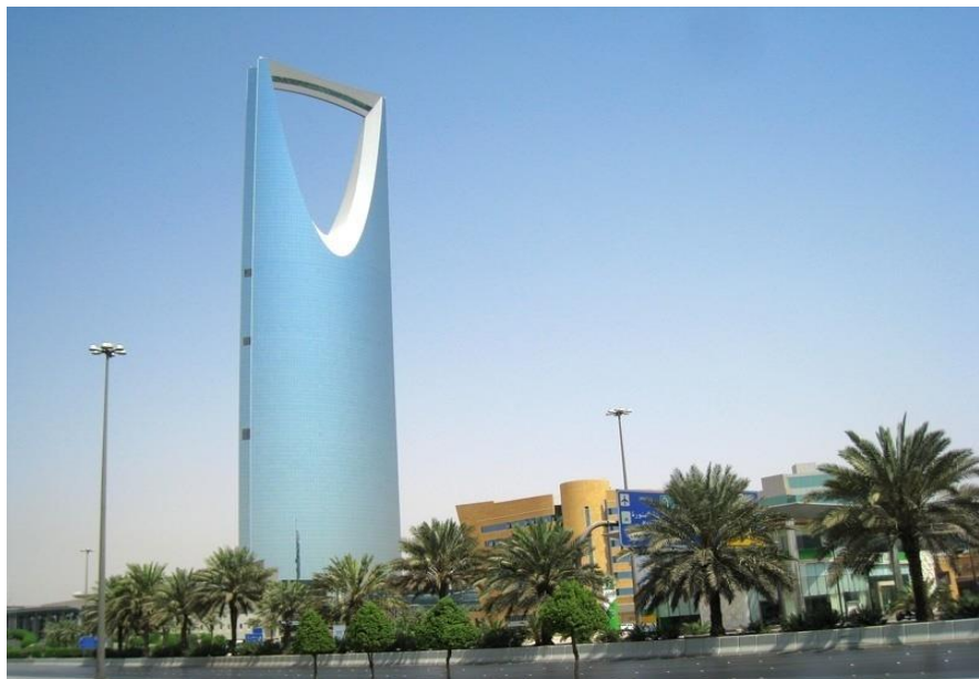
利雅得王国中心大厦

沙特石油剩余可采储量2670亿桶，占世界储量的17%，居世界第二位；天然气剩余可采储量9万亿立方米，占世界储量的4.6%，居世界第五位。沙特还有金、铜、铁、锡、铝、锌等矿藏。沙特是世界上最大的淡化海水生产国，其海水淡化量占世界总量的20%左右。