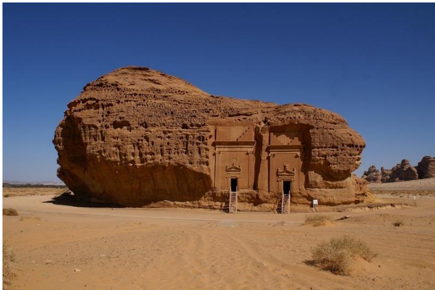
世界文化遗产——美达因萨利赫

在沙特的华人华侨以从事小商业、旅店等服务业为主，少数人在沙特政府部门、商工会、学校、企业等任职。