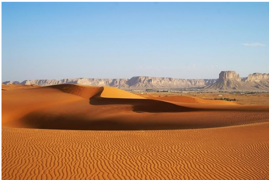
利雅得市郊红沙漠

公元7世纪，伊斯兰教创始人穆罕默德的一些继承者建立阿拉伯帝国，8世纪为鼎盛时期，版图横跨欧、亚、非三大洲。11世纪阿拉伯帝国开始衰落，16世纪为奥斯曼帝国所统治。19世纪英国侵入，当时分汉志和内志两部分。20世纪初，内志酋长阿卜杜勒阿齐兹·沙特经过30年征战，逐步统一了阿拉伯半岛，1924年，阿卜杜勒阿齐兹·沙特兼并汉志，次年自封为国王，1932年9月23日，宣告建立沙特阿拉伯王国，这一天被定为沙特国庆日。