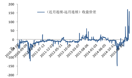
图2、IF（远月-近季）历史价差