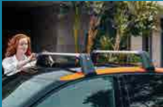
ATAP TRANSVERSE BAR