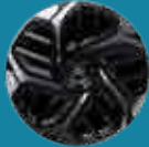
18" BERWARNA CAMELIA RODA ALLOY TERSEDIA DI FLAIR DAN PAKET FLAIR