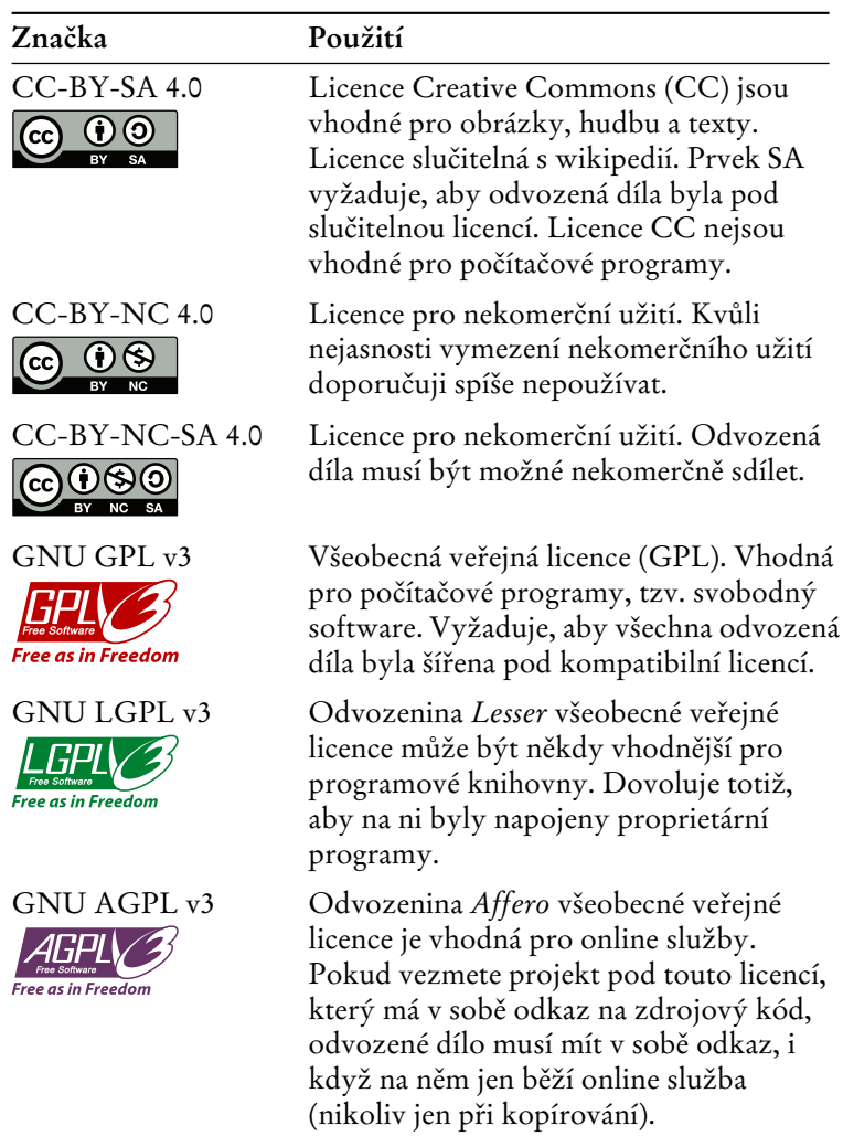
Tabulka 2: Doporučené školní licence.