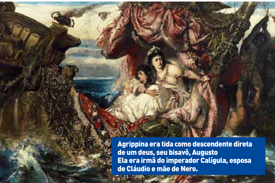
Agrippina era tida como descendente direta de um deus, seu bisavô, Augusto. Ela era irmã do imperador Calígula, esposa de Cláudio e mãe de Nero.

Para saber mais sobre Parafilias, leia o Livro do mesmo autor: “PARAFILIAS, IGREJAS E SOCIEDADE ATUAL”