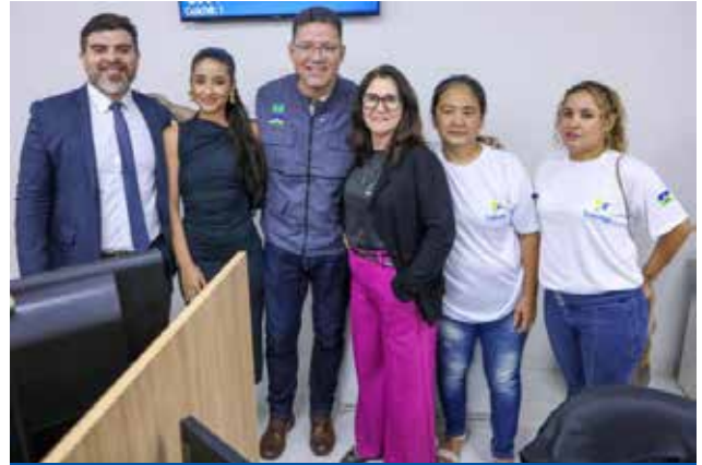
A unidade do Tudo Aqui está localizada no Park Shopping Vilhena