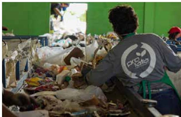
A coleta seletiva foi implantada em Jaru em setembro de 2025

A Cooperativa conta com um veículo exclusivo para a coleta porta a porta, atendendo tanto residências localizadas na sede do município quanto nos distritos, realizando a coleta de materiais recicláveis como papel, plástico, vasilhames de vidro, alumínio, óleo de cozinha armazenado em garrafa pet e também lixo eletrônico (telefones, TVs, PCs, pilhas, lâmpadas e outros).