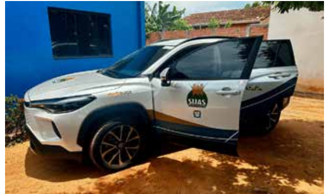
Veículo será uma ferramenta para atuação da secretaria