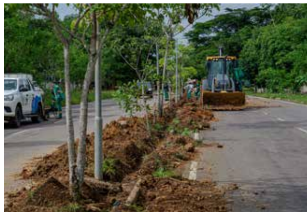
O projeto vai muito além de ser uma medida estética

O prazo para execução da primeira fase do projeto é de cinco anos, sendo que ele será dividido em três etapas. A projeção é que, em um período de até 20 anos, não exista mais qualquer fiação aérea no perímetro urbano da capital rondoniense.