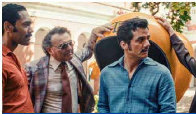
Sessões serão diárias e terão ingressos a preço promocional

Após conquistar dois prêmios no Globo de Ouro (Melhor Filme em Língua Não-Inglesa e Melhor Ator em Filme de Drama, com Wagner Moura), o filme nacional “O Agente Secreto” retornou ontem à programação do Cine Araújo, no Porto Velho Shopping. A produção será exibida em sessão diária, com ingressos ao valor promocional de R$ 12.