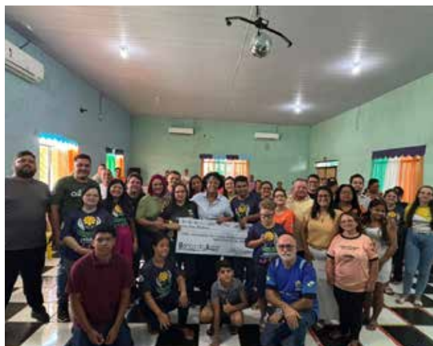
Os recursos serão utilizados para ajudar no custeio da instituição