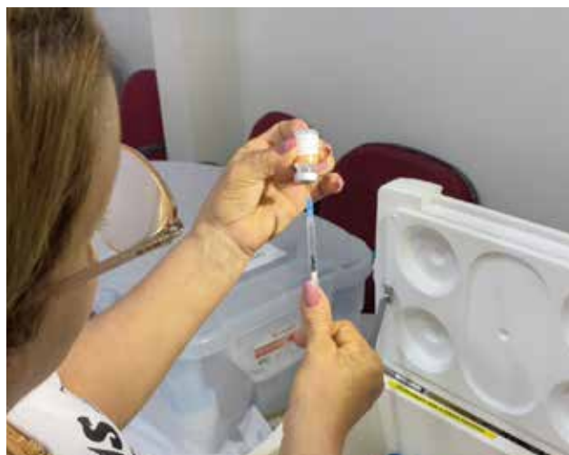
A adesão da população às campanhas de vacinação é grande

A Secretaria Municipal de Saúde reforça que a vacinação continua disponível nas unidades básicas de saúde da capital e dos distritos. Para se vacinar, é necessário apresentar documento oficial e o cartão de vacinação.