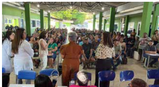
Assdaco fechou o período com um conjunto robusto de iniciativas

A ASSDACO também conta com a parceria da Anga e do Laboratório CID, para a realização de exames, e de quatro médicos urologistas, dois mastologistas, entre outros especialistas, para que o paciente seja atendido imediatamente, a partir do seu diagnóstico. A união entre as instituições permite alcançar um público ainda maior e diversificado, reforçando a importância da cooperação entre entidades de saúde.