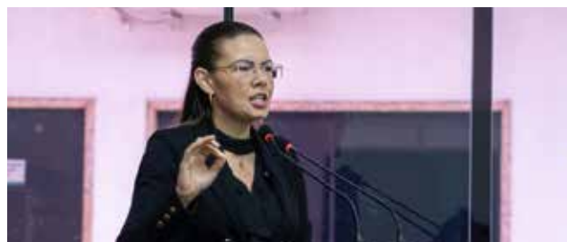
A vereadora lembrou de demandas nunca atendidas

Renda - A vereadora também cobrou avanços em pedidos relacionados à recuperação de ramais, fundamentais para o escoamento da produção da agricultura familiar e para o fortalecimento dos pequenos e médios empresários. Para ela, oferecer estradas em condições adequadas é o mínimo que o poder público pode garantir a quem gera emprego e renda no município.