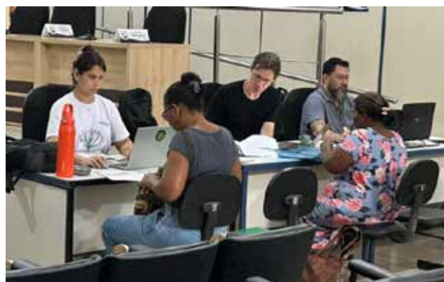
A iniciativa foi organizada pelo Projeto Floresta+ Amazônia