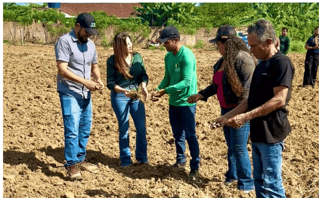
A deputada esteve no assentamento nesta semana