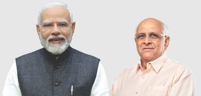
શ્રી નરેન્દ્ર મોદી