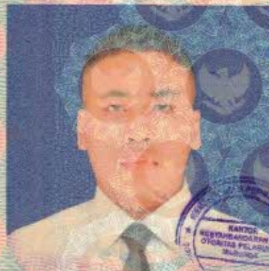
Photo Pemegang / Photograph of holder

[Signature] Tanda tangan pemegang atau Sidik Ibu jari Kiri Signature of Holder or Left Thumb Print