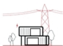
NAŠE KONTEJNERY DOSTANETE VŽDY ČISTÉ A S ELEKTROREVIZÍ