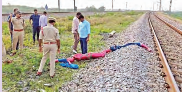
సీన్ రికన్‌స్ట్రక్షన్ తీరును పరీశీలిస్తున్న పోలీసులు