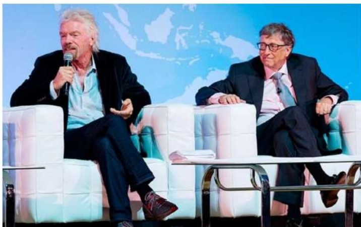
Bill Gates und Richard Branson haben bei der aufregendsten Elektronikmesse der Welt, der CES 2025 in Las Vegas, über Bitcoin Era gesprochen.

Bitcoin Era wird auch von einigen der klügsten technischen Köpfe genutzt – etwa Richard Branson, Elon Musk und Bill Gates .