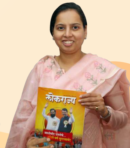
अदिती तटकरे मंत्री, महिला व बाल विकास