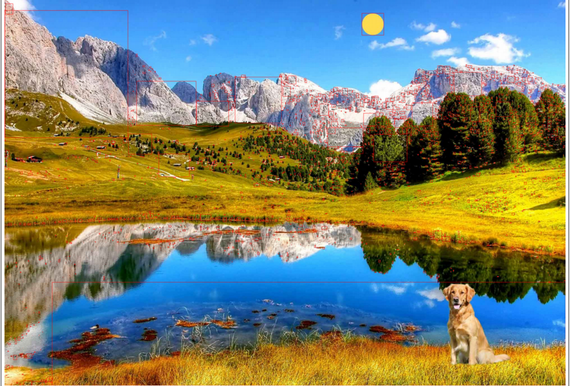
Failed (3 minuts to compare)