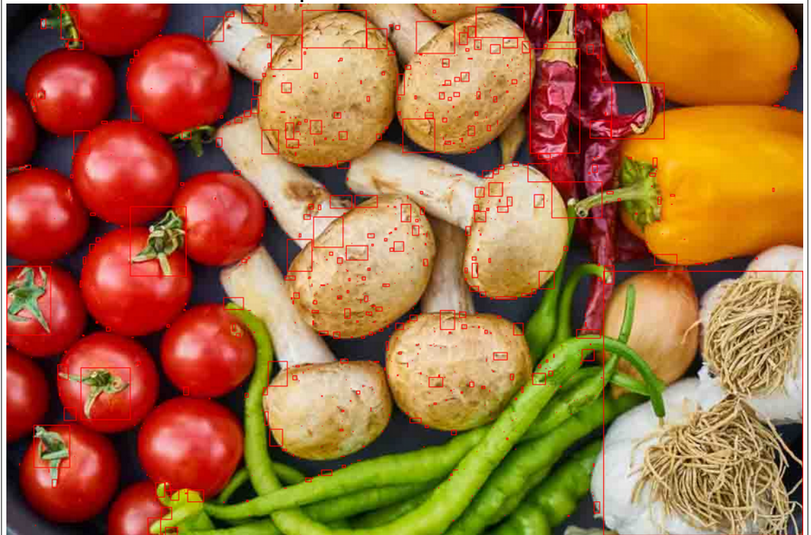
Result pixelToleranceLevel = 0.2