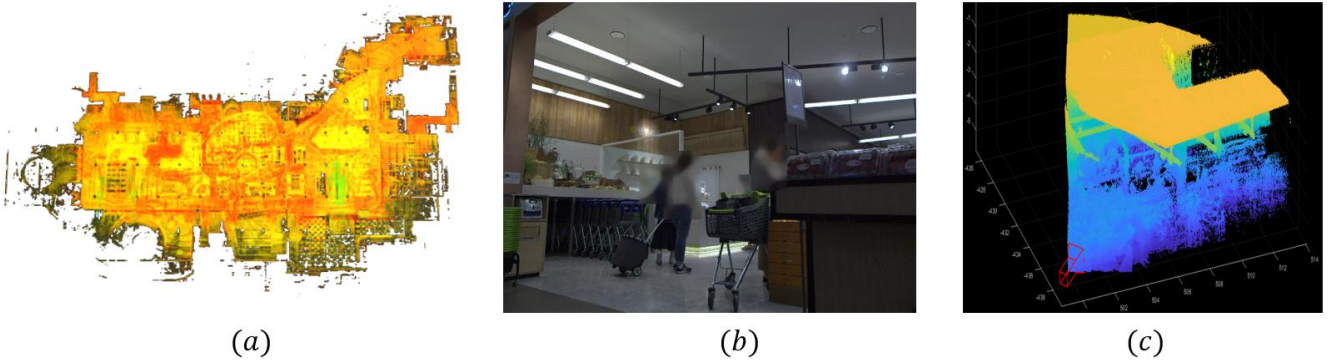
그림 2 고정밀 지도와 지도 내 영상의 위치 정보를 이용해 획득한 3차원 정보 예시, (a)는 지하 1층의 고정밀 3차원 지도 (b)는 Top-1 영상 (c)는 Top-1 영상과 쌍을 이루는 3차원 정보

간의 연관성과 각 영상 내 지역 기술자 간의 연관성을 활용하여 Attentional GNN(Graph Neural Network) 설계 및 학습시키는 방법론이다. 해당 방법론은 두 영상 간의 지역 정합 시, 각 영상마다의 지역 기술자 분포 및 관계 정보도 활용하기에 좋은 표현력으로 지역 정합이 가능하다.