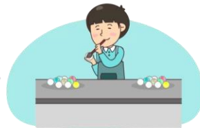
로스트볼을 색칠하여 미술작품 만들기