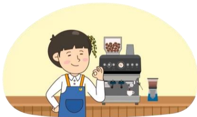
커피머신 고장 확인하기