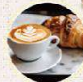
Croissant Cappuccino (1-7-8) 3.20€