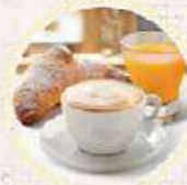
Croissant juice Cappuccino (1-7-8) 7.00€