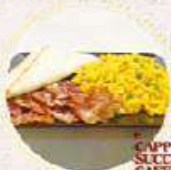
Scrambled eggs bacon butter (1-3) 8.50€