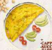
Omelette butter avocado (1-3) 8.50€