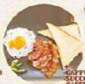
Eggs bacon bread butter (1-3) 8.00€