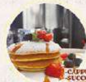
Sweet pancake (1-3-7) 6.50€