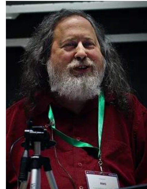
Рис. 2 Richard Stallman

В 1983 году Ричард Столлман инициировал проект GNU с целью создания свободной UNIX-подобной операционной системы.