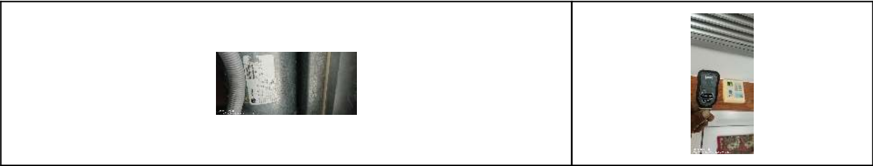
Post Operation Images