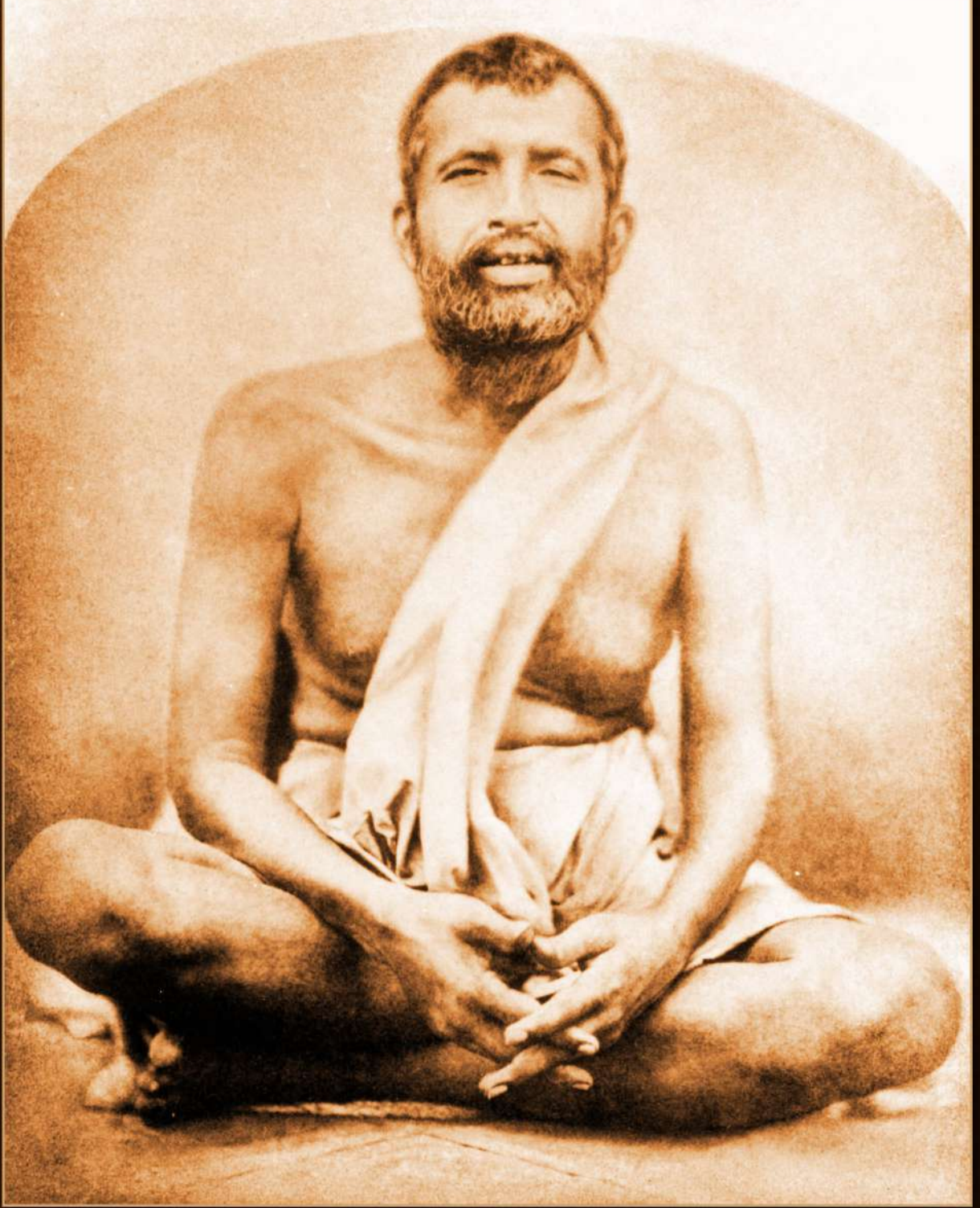
శ్రీ రామకృష్ణ పరమహంస జయంతి (18-02-2022)