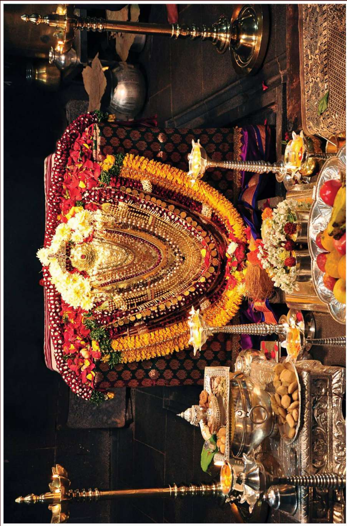
శ్రీ మాణిక్య ప్రభు ఆరాధన (11.12.2024 - మార్గశిర శుద్ధ ఏకాదశి)