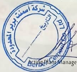
Acting Plant Manager