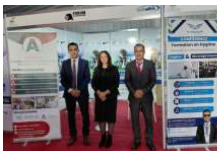
PARTICIPATION DE L'ASSOCIATION AMARINNOVA AU FORUM DE L'ÉDUCATION, 4 e ÉDITION. AU CITÉ DES MÉTIERS ET COMPÉTENCES À NOUACER