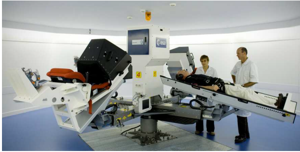
Centrifugeuse humaine développée par le CNRS / MEDES

Le paramétrage de la centrifugeuse est donnée ci dessous :